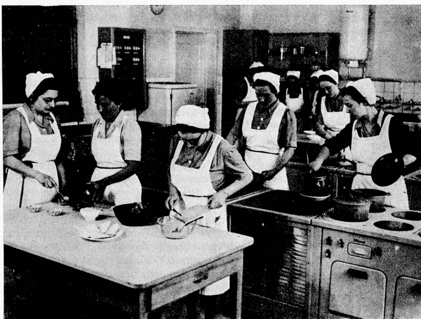
In der Lehrküche

Ich hatte Glück, gleich die erste Stelle konnte ich in einem Krankenhause antreten. Der Wirkungskreis war bescheiden: Führung der Lingerie und Wäscherei. Würde das je ein interessanter Posten sein?