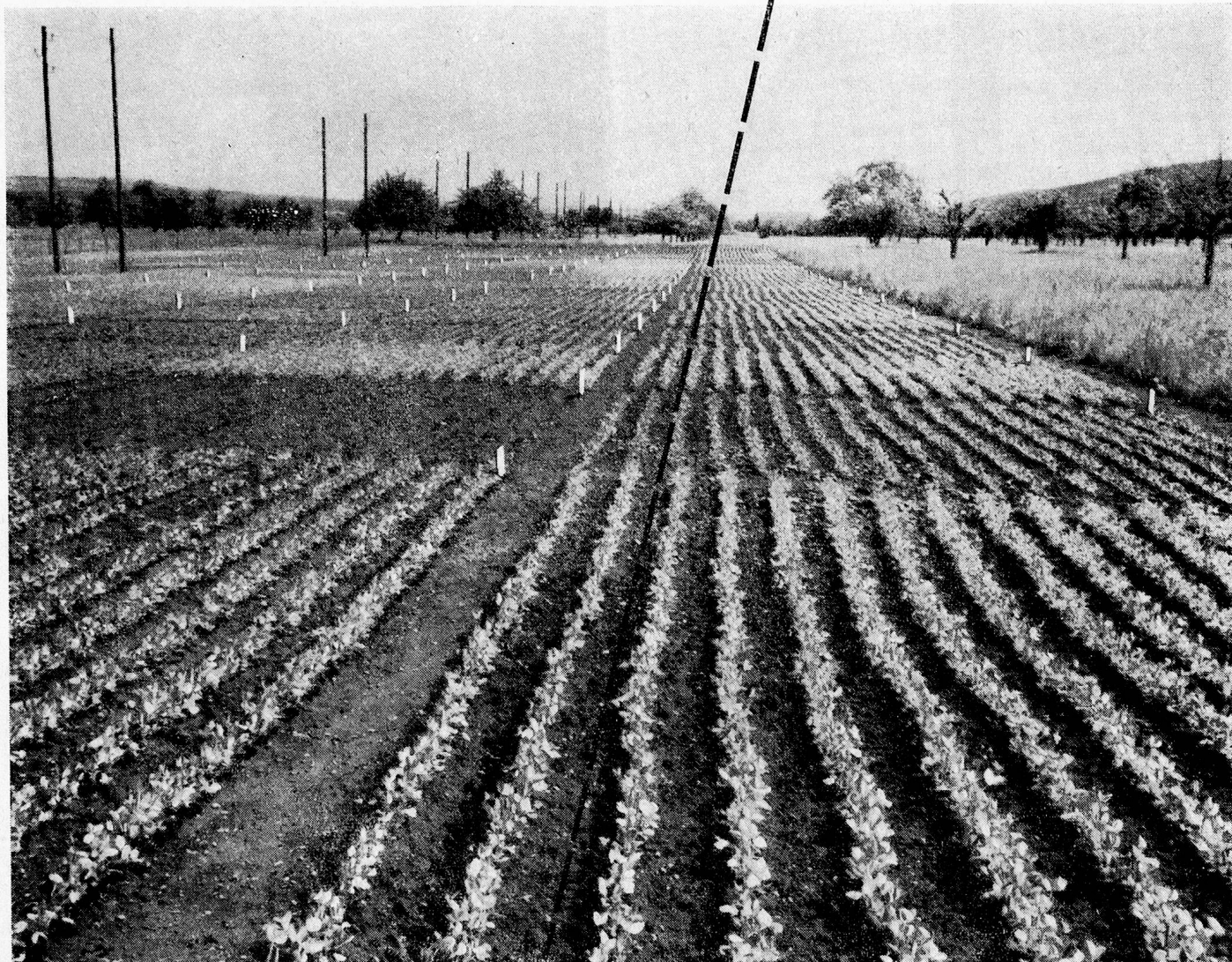
Erbsen-Versuchsfeld in Frauenfeld

Seit Jahrzehnten können wir in den eigenen Versuchsgärten das Gedeihen, den Ertrag und die Qualität der verschiedenen Erbsensorten laufend verfolgen und verbessern. Darum sind die Hero-Gourmet-Erbsen so einzigartig in ihrer Feinheit und Nährkraft. Unsere Versuchsgärten lehren uns die rationellste Bewirtschaftung der Plantagen. Wir können Ihnen deshalb die besten Erbsen so vorteilhaft anbieten.