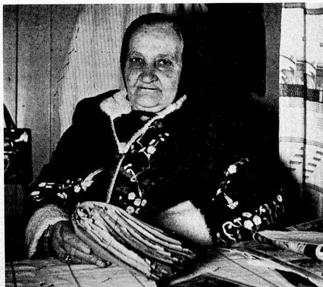
Das russische Grossmütterchen, das auch noch, wo es kann, fleissig die Hände regt, erfreut sich allgemeiner Beliebtheit.

Es sind auch zwei jüngere Ehepaare da, die aufgenommen wurden, weil beide Männer Invalide sind. Beide Paare mussten etwa 5 Jahre im Lager von Schanghai warten, bis man sie über Hongkong per Flugzeug in die Schweiz brachte. Die eine der Frauen, eine frühere Haushälterin und Gouvernante, arbeitet eifrig in Haus, Küche und Wäscherei mit, die andere in der Krankenstube, in der es bei so vielen alten Leuten fast immer zu tun gibt. «Und wenn es ans Letzte geht, lasse ich meine Pflinglinge nicht aus dem Haus, sofern der Arzt es nicht ausdrücklich anordnet; sie sind bei uns daheim und daheim sollen sie auch sterben dürfen», sagte uns die von allen aufrichtig geliebte Heim-Mutter.