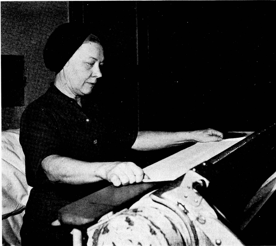
Einst war sie Haushälterin und Gouvernante bei vornehmen Familien in China. Heute hilft sie im Schweizer Altersheim tüchtig in Haushalt und Glätterei.

Die Männer der beiden Russinnen helfen, wo immer es geht, in Haus und Garten. Der eine, ein früherer Herrencoiffeur, übt jetzt seine Kunst bei den männlichen Heiminsassen aus; er selber geht fürs Haarschneiden zum Dorfcoiffeur, und dann trinken die beiden Berufskollegen gewöhnlich noch ein Bier miteinander und verstehen sich auch mit wenig Worten gut, denn beide wissen sie um Wert und Segen recht getaner Arbeit. Ueberhaupt sind die «China-Russen» im Heim wie im Dorf beliebt, weil sie dankbar, freundlich und hilfsbereit sind. Selbst die alte «Babuschka», das Grossmütterchen, wie sie genannt wird, bleibt nicht untätig. Und dies selbstverständliche Zugreifen der Menschen, die vieles durchgemacht und dennoch nicht den Mut verloren haben, wirkt ansteckend. Wenn die russischen Frauen in Küche und