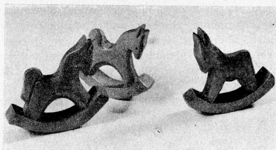
Rösschen — Eselchen

Abgesehen von einer kurzen Anfangsperiode ist es mir bisher noch nicht gelungen mit Zöglingen zu