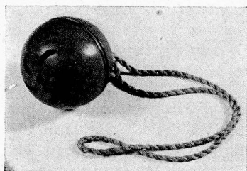
Spielkugel mit Holzgriff oder Seidenband

Bisher konnte ich als selbständiger Betrieb bestehen, wenn auch oft mit Schwierigkeiten, die mit dem Aufbau und mit dem Mangel an Kapital meist verbunden sind. Wir begannen so klein als nur möglich, sozusagen mit nichts. — Die angefangene Arbeit sollte meines Erachtens ihre Selbständigkeit behalten. Vielleicht könnte sie als selbständiger Zweig einem be-