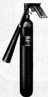
Abb. 3 Primus Typ CO 2 /3 P

vorwiegend bei Bränden der Klasse 2 der Fall sein, z. B. in Küchen, wo heisses Fett oder Oel sich entzünden kann. Hier wird es ratsam sein, ein anderes Löschmittel zu verwenden als Luftschaum, der mit