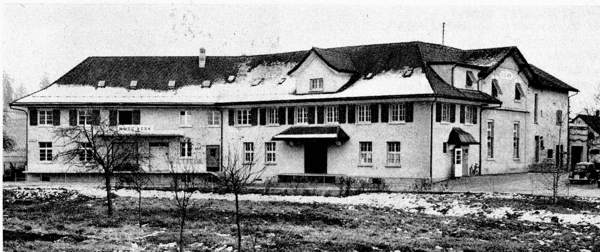
Gesamtansicht des Nuxo-Werkes