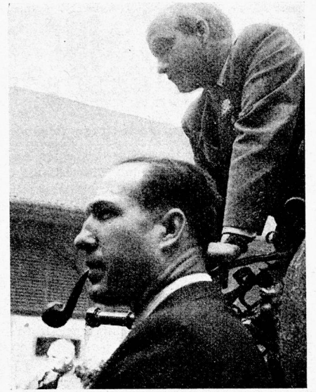
Allgemein bekannte Mitglieder des VSA

schaft und wünschen ihnen ein segensreiches Gedeihen dieses Werkes.