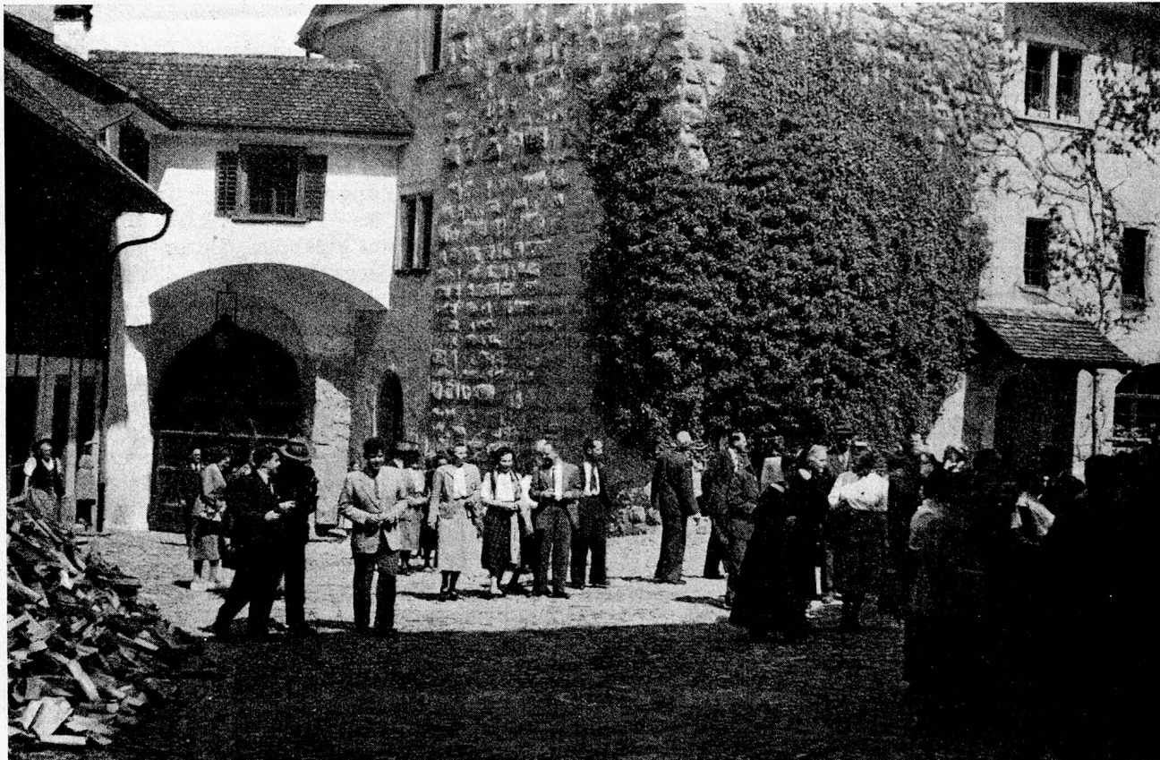
Der VSA auf der Kyburg

Ein währschafter Abendimbiss nach den ersten beiden Referaten bildete eine angenehme Pause. Bis zum gemeinsamen Abendessen blieb dann