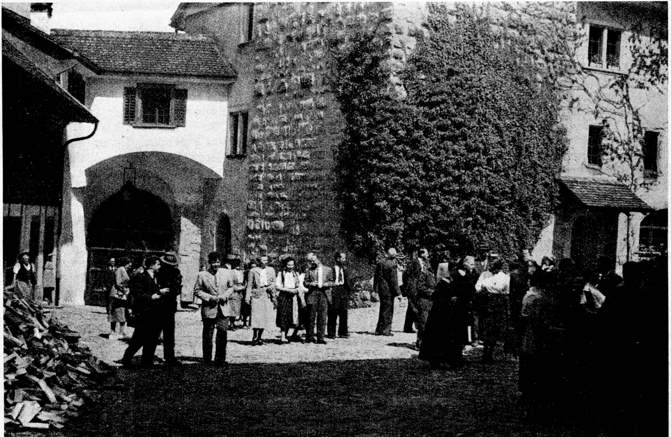
Der VSA auf der Kyburg

Ein währschafter Abendimbiss nach den ersten beiden Referaten bildete eine angenehme Pause. Bis zum gemeinsamen Abendessen blieb dann