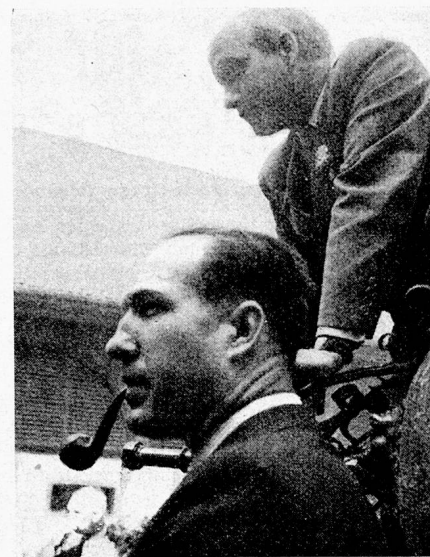
Allgemein bekannte Mitglieder des VSA

schaft und wünschen ihnen ein segensreiches Gedeihen dieses Werkes.