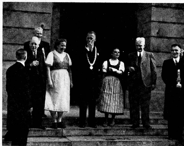
Empfang beim Bürgermeister von Utrecht

Schon der heutige Tag schenkt uns etwas vom Besten, was eine solche Reise wohl zu geben vermag: Wir finden Menschen, mit denen wir uns trotz aller Verschiedenheit ohne weiteres gut verstehen. Wenn man so, wie meine Frau und ich, im Laufe eines Vierteljahrhunderts ein neuartiges Heim erst schaffen musste und dabei oft nicht so leicht verstanden worden ist, dann ist es erhebend, zu sehen, dass da im fremden Land Menschen in ähnlicher Arbeit die gleiche innere Haltung ihr gegenüber einnehmen, dass die Ansichten die gleichen sind — so andersartig dies oder das auch