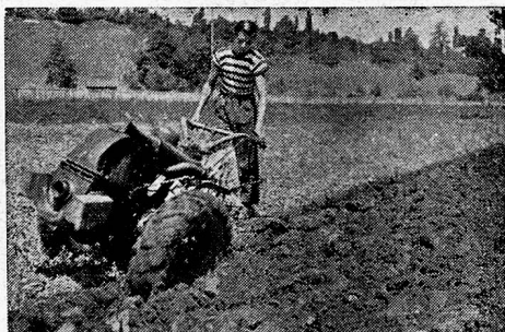
Typen 1944: 4, 8 und 10 PS.