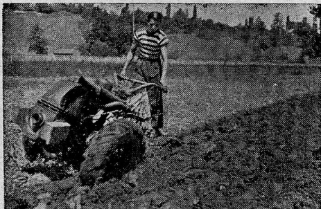
Typen 1944: 4, 8 und 10 PS.