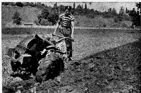
Typen 1944: 4, 8 und 10 PS.