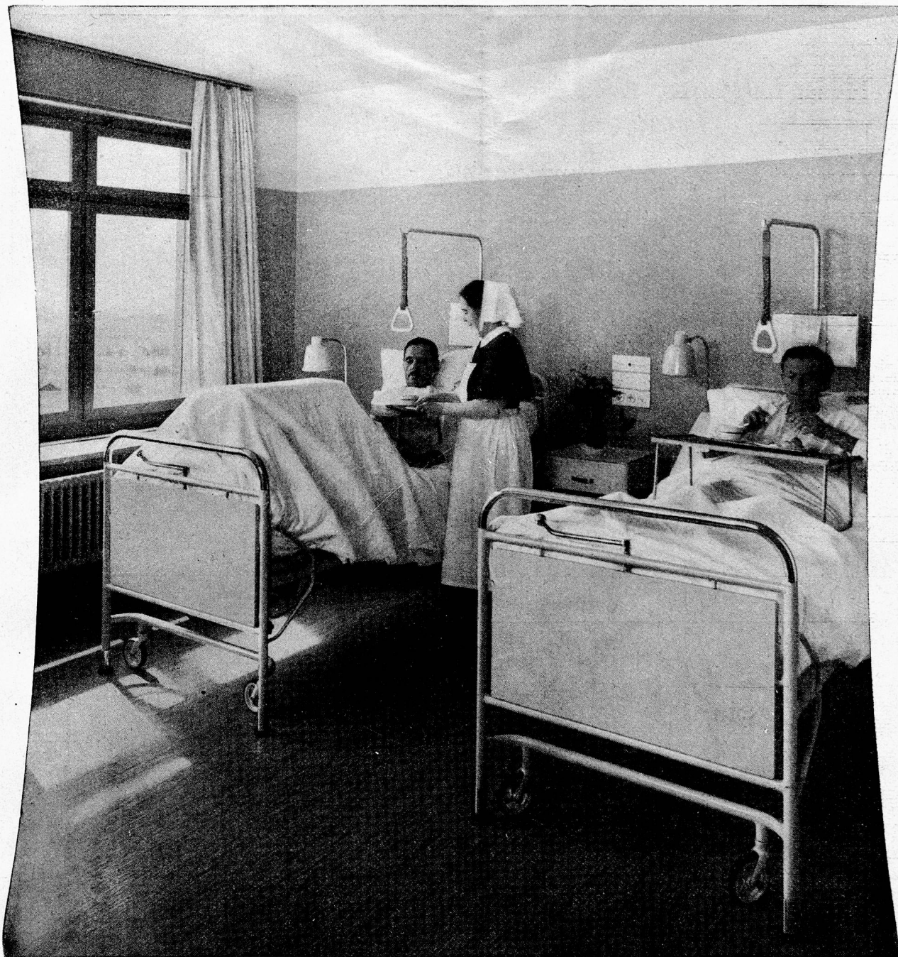
Hebebetten mit neuer Hebelanordnung über dem Fußbrett