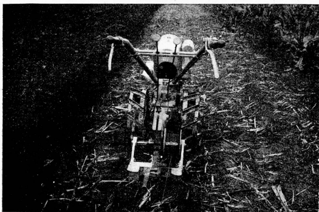
Neue 8 PS Grunder-Bodenfräse mit einfacher Seilwinde für Winter-Pflugarbeit

Die Maschinenfabrik Grunder-Binningen bringt nun auf 1938 eine neue 8 PS Bodenfräse heraus, in welcher die beinahe 20-jährigen Erfahrungen mit ihren bewährten 2—4 und 6 PS Bodenfräsen verwertet sind. Mit ihren 4 Gangarten und 2 verschiedenen Fräsgeschwindigkeiten bietet diese neue Maschine neue, weitgehende Variation von feinsten, tiefer Krümelstruktur bis faustgroßen Brocken, zweifellos eine neue, wichtige Entwicklungsstufe der Bodenfräskultur.