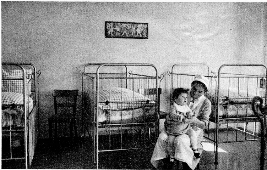
Neubau Kinderheim Bühl Wädenswil