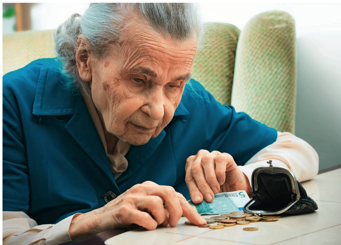
Les coûts d'un séjour en EMS à charge de la personne peut fortement varier d'un canton à l'autre.

Seules les personnes avec des revenus très élevés n'ont pas besoin de puiser dans leur fortune.