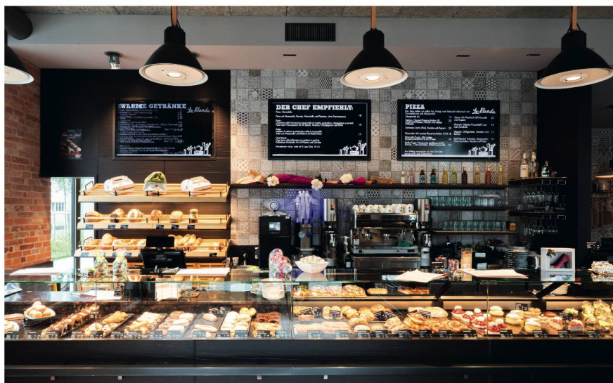
Le grand choix de la succursale Wüst dans la Greencity de Zurich.

Pistor AG Centre de Distribution Romand Route de Saint-Marcel 22 CH-1373 Chavornay + 41 24 447 37 37 / pistor.ch