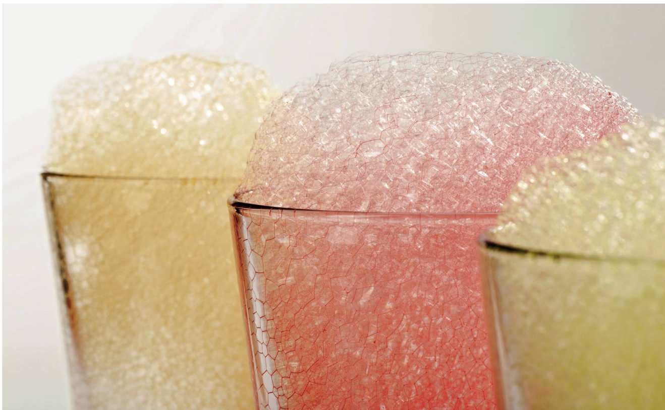
Mousses: écume de lard, mousse de radis et mousse de persil (de gauche à droite).

déclencher en abordant le sujet de « l'alimentation en fin de vie » et, de ce fait, évitent d'en parler.»