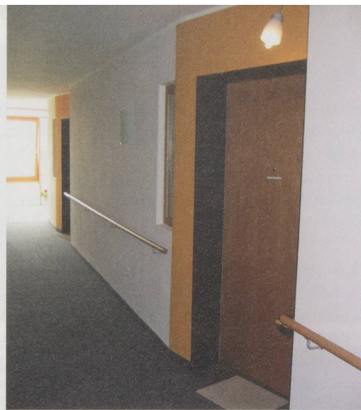
Des portes qui se fondent dans les parois de même couleur: les personnes souffrant de déficit visuel n'ont aucune chance de retrouver leur chambre (à g.). Des couleurs contrastées, des portes renfoncées et une entrée clairement signalée: exemplaire (à d.)