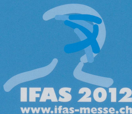
Exhibit & More SA · Bruggacherstrasse 26 · Case postale 185 · CH-8117 Fällanden-Zürich/Suisse T +41 (0)44 806 33 77 · F +41 (0)44 806 33 43 · info@ifas-messe.ch · www.ifas-messe.ch

... et plus que 300 exposants renommés supplémentaires vous attendent.