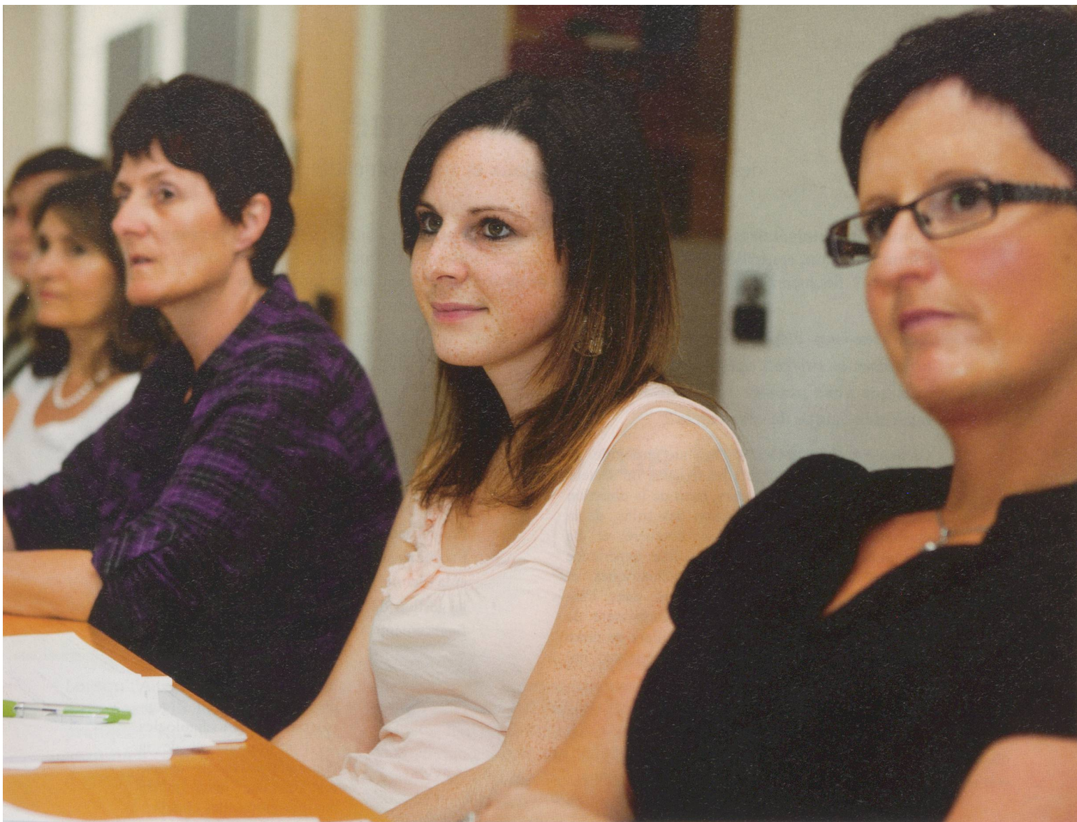
... Le programme de formation «Direction d'institution, niveau 1» se déroule d'avril 2011 à avril 2012.