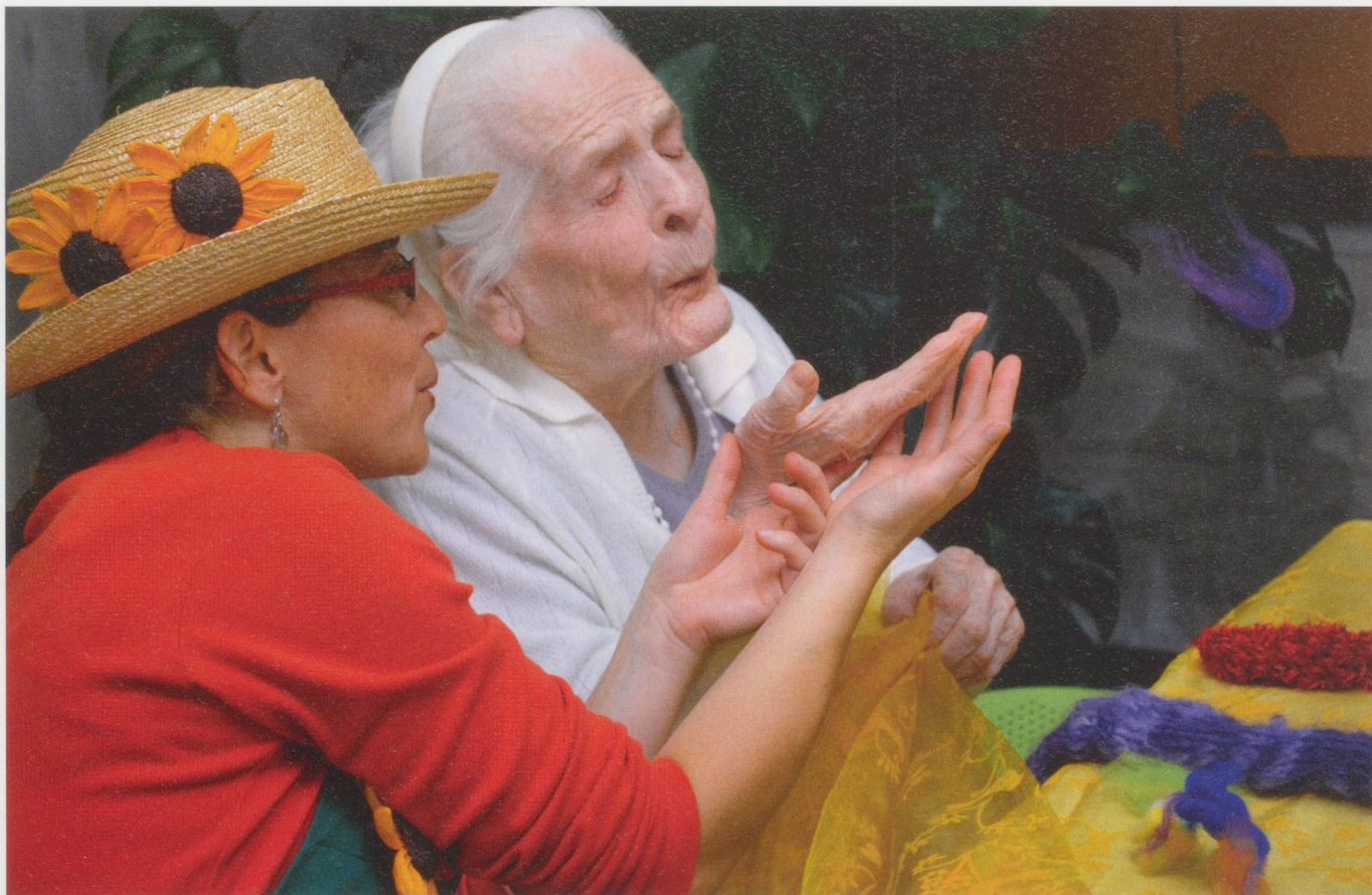
Les objets utilisés sont mis en jeu pour réveiller les sensations encore perceptibles.

ensuite des balles, des pompons, des foulards, des plumes et autres objets colorés, qu'elles proposent aux résidents et qui vont passer de mains en mains, ou finir dans le jardin imaginaire qui prend forme à un bout de la table. Pour leur part, les deux «jardinières» discutent, posent des questions, plaisantent, chantent, écoutent aussi, au passage ramassent une