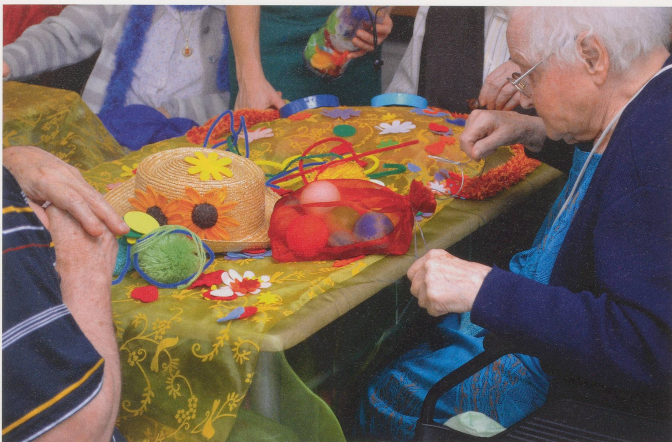
Les Colporteurs'Couleurs s'appuient sur les couleurs pour favoriser la relation.