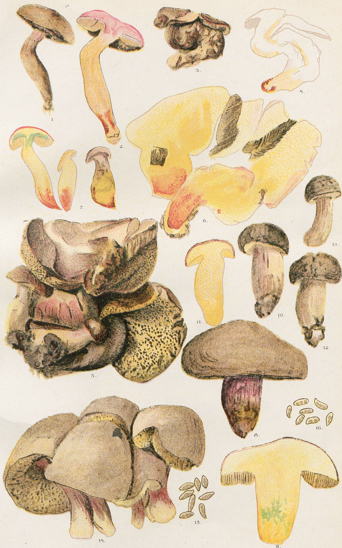
1-7, Sous-espèce dedivitatum . - 8-15, Sous-espèce subluridus . - 15 Spores du N° 14. - 16, Spores du N° 5.