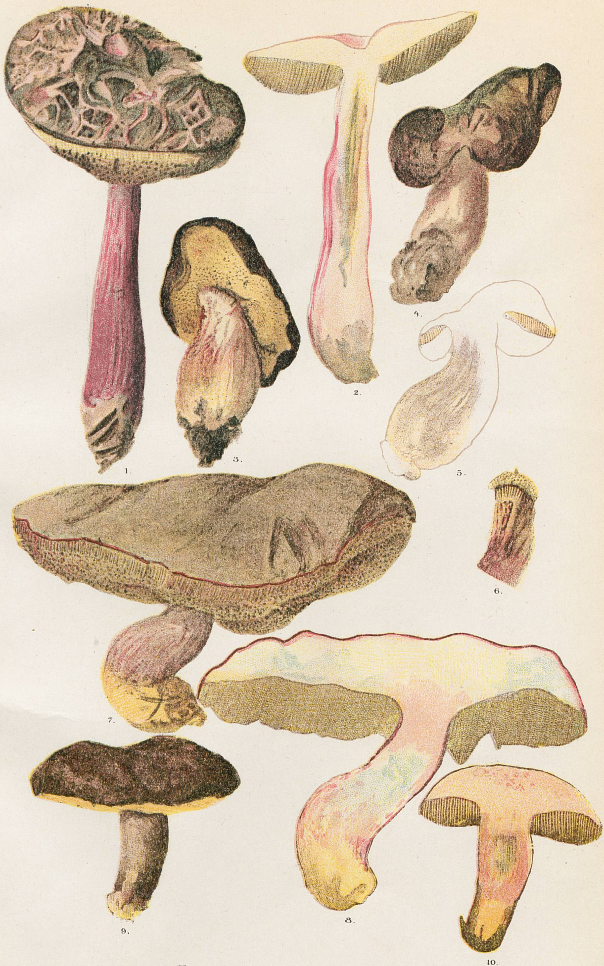
Formes de forêts de conifères.

1 et 2, Palezieux. - 3-6, Marécottes. - 7 et 8, Pélons. - 9 et 10, Pointe de Targuillan.