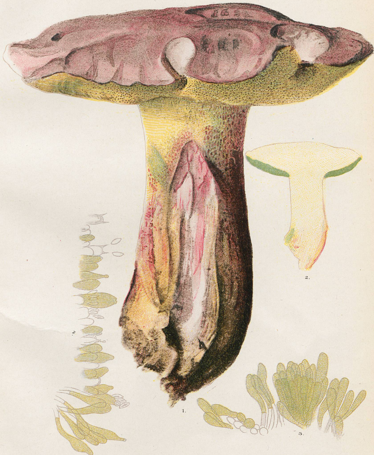
1 et 2, Sous-espèce cerasinus . 3 et 4, Marges de tubes, pris en des points différents d'un punctalipes provenant de Braz-de-Fort.