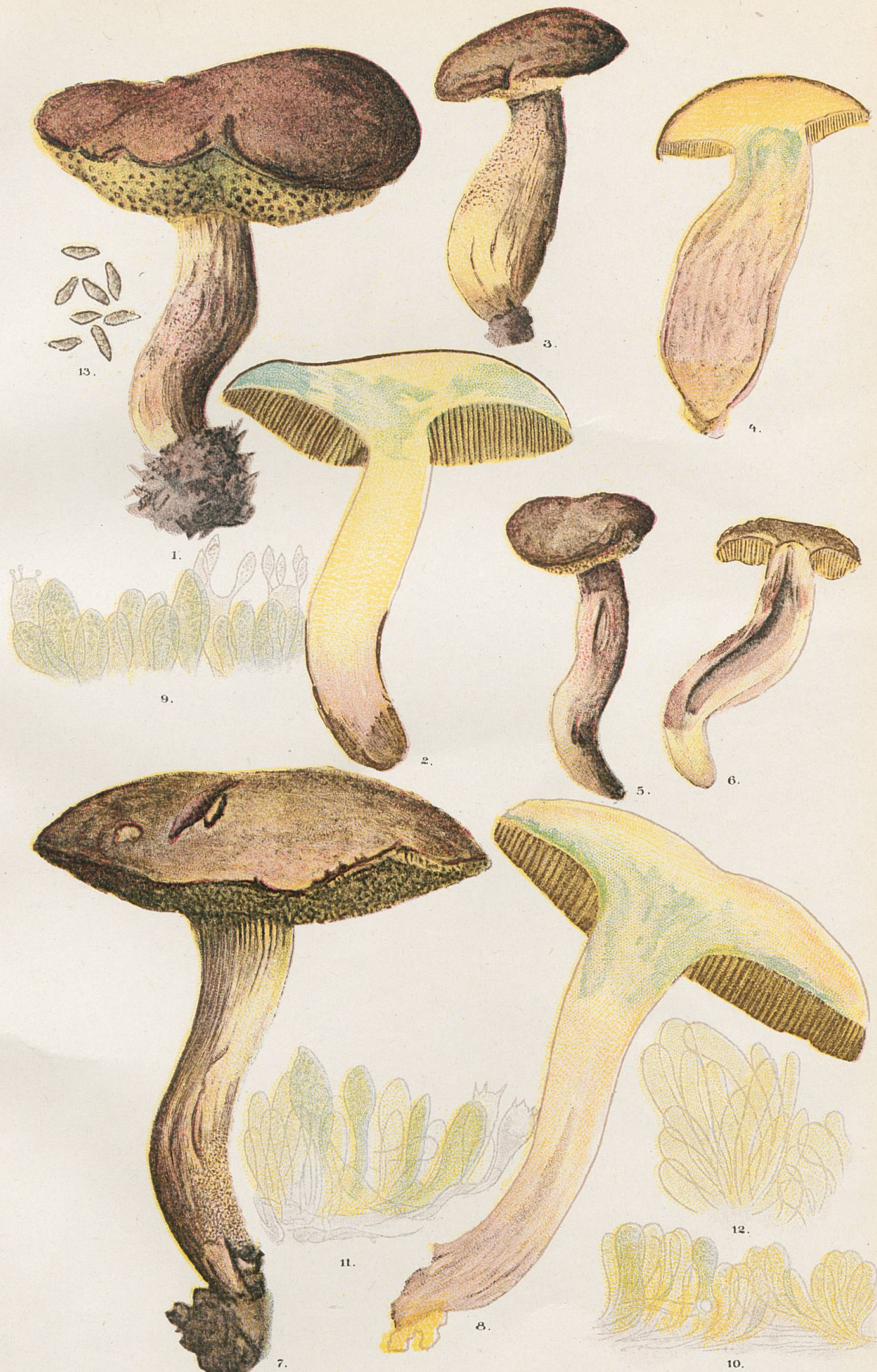
1-6, Sous-espèce punctatipes.-7 et 8 Sous-espèce sulcatipes.-9 Coupe d'une strie vers le haut du pied. 10, Coupe longitudinale d'une moucheture de strie vers le haut du pied.- Coupe transversale d'une moucheture de strie vers le haut du pied.- 12, Coupe d'une moucheture de strie vers le milieu du pied.- 13, Spores du N o 1.