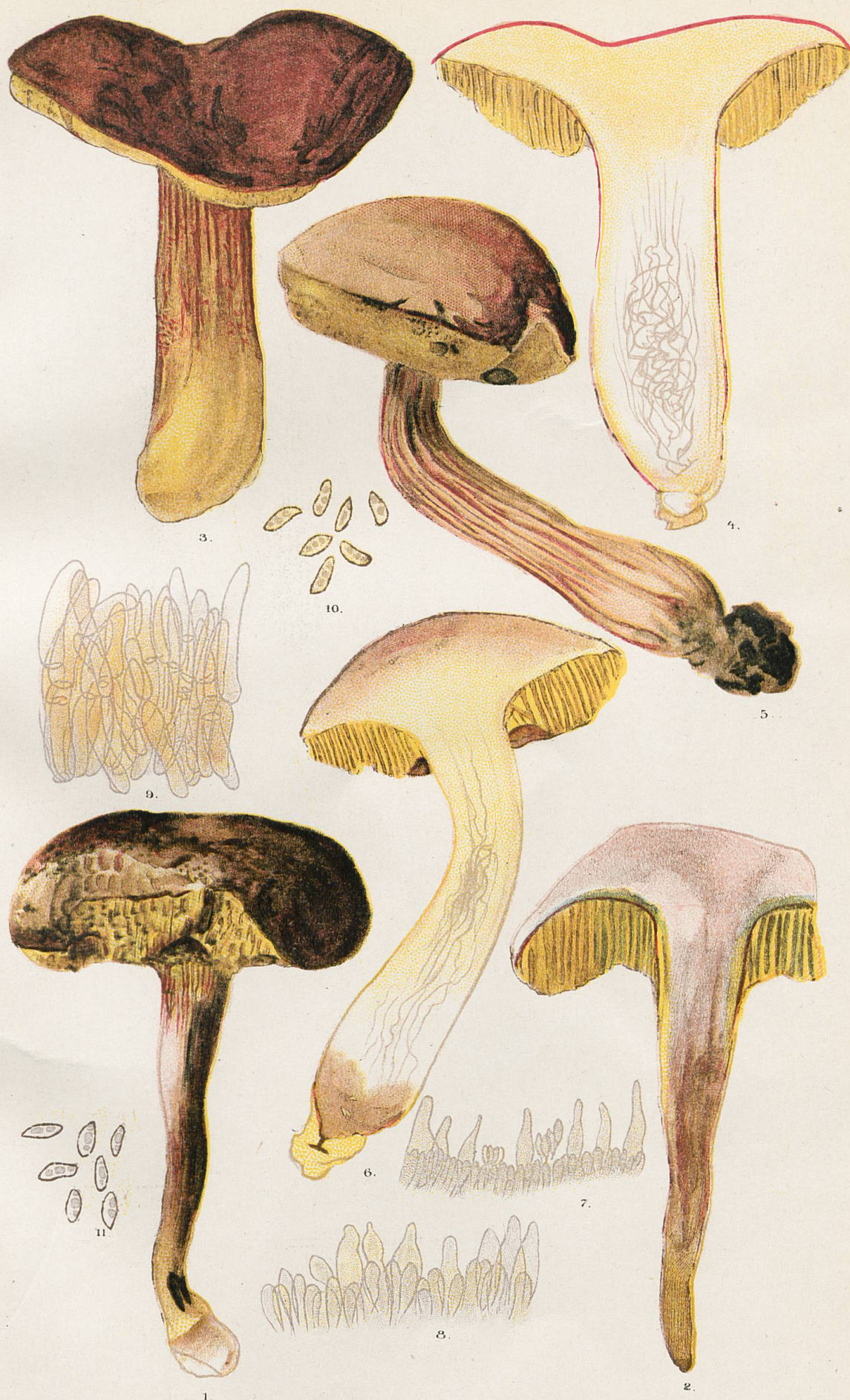
1 et 2, Sous-espèce sulcalipes . - 3 à 6, Sous-espèce costatipes . - 7, Coupe microscopique de nervure au sommet du pied. - 8 Id. à 5 mm. de la couche des tubes. - 9, Tomentum du chapeau. - 10, Spores du N° 3. - 11, Spores du N° 1.