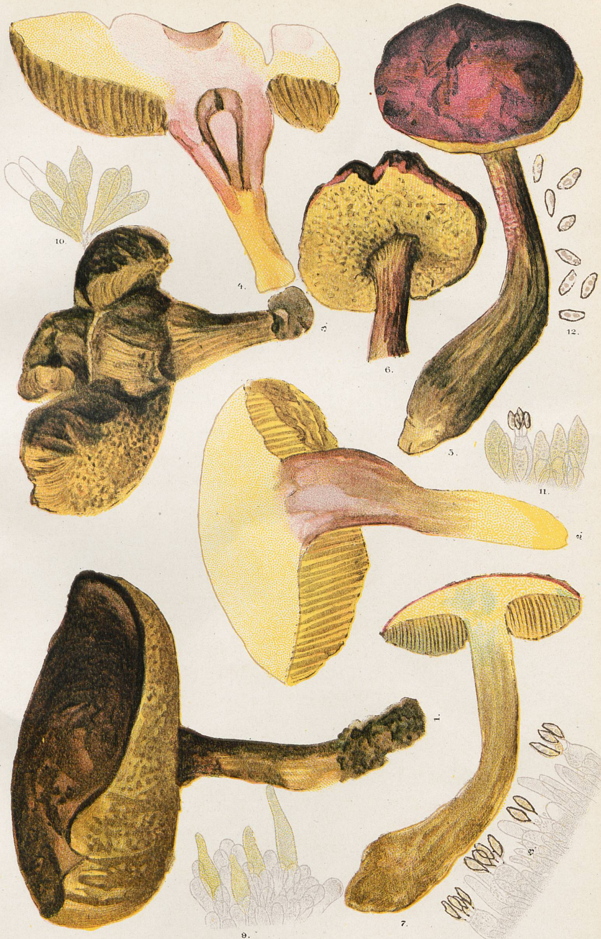
1-7, Sous-espèce sublevipes . - 8, Marge de tube lamelliforme. - 9, Marge de tube normal. 10 et 11, Autres marges de tube. - 12, Spores du N o 5.