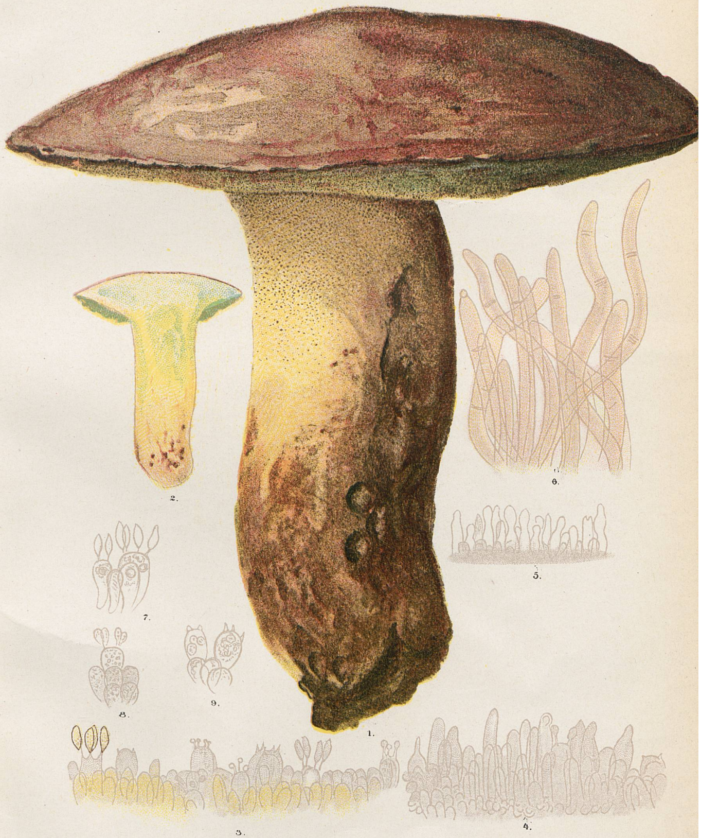
1 et 2. Sous-espèce irideus . - 3. A la marge d'un tube de la fig. 3 pl. III. - 4. A la marge d'un tube jeune de la fig. 5, pl. I. - 5. A la marge d'un tube vieux de la fig. 5 pl. I. - 6. Tomentum d'un individu provenant de Praz-de-Fort