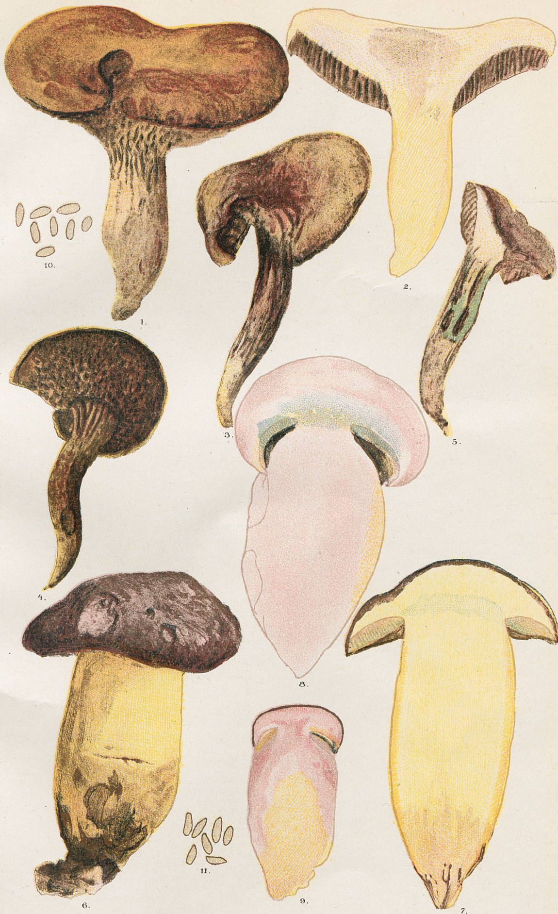
1-5, Sous-espèce Flavens . - 6-9, Sous-espèce irideus . - 8 et 9, Coupe d'individus non figurés. 10, Spores du N° 1. - 11, Spores du N° 6.