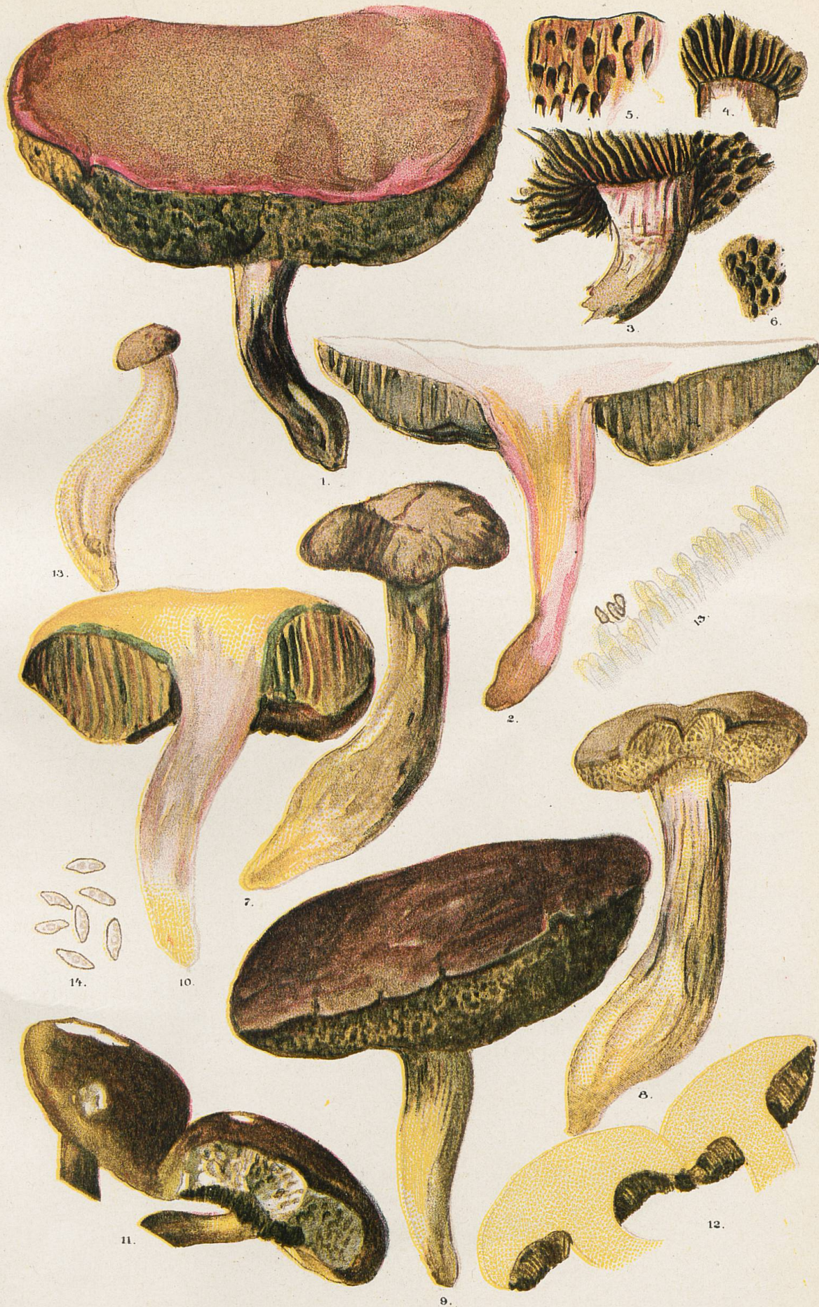
1-10 et 13, Sous-espèce sublevipes. - (3 et 4, tubes en lamelles vers le pied du N°1. - 5, Pores à la marge du N°1. - 6, Pores au milieu du N°1. - 13, Marge de tube. - 14, Spores). - 11 et 12, Sous-espèce sulcatipes.