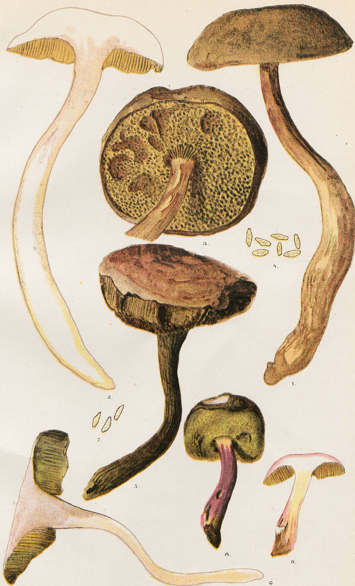
Formes de forêts de conifères.

1-4, Chapelle-Rambaud. - 5-7, Chalel-à-Gobet. - 8 et 9, Palézieux.