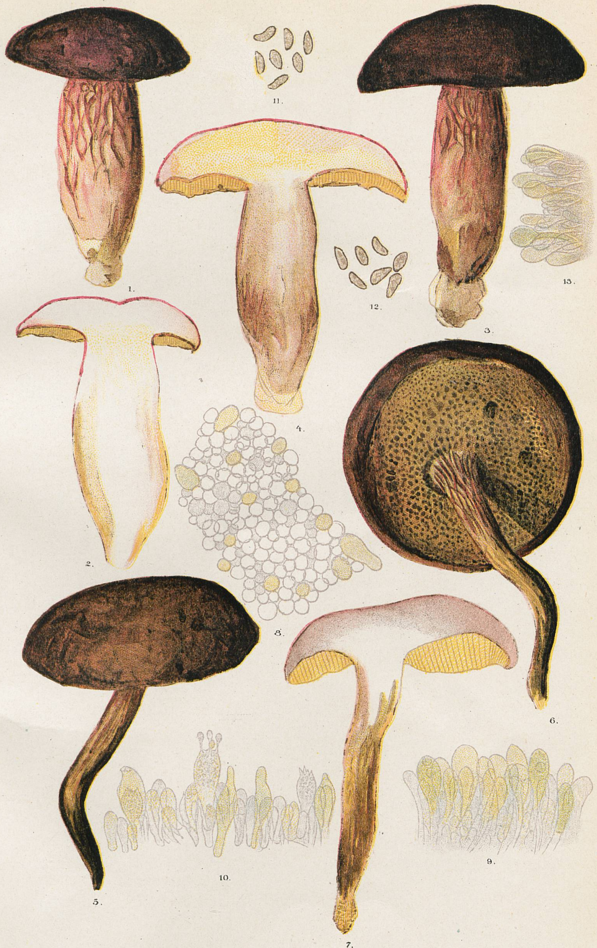
1-7, Sous-espèce reticulatipes . - 8, Hyménium vu par transparence. - 9, Marge de tube. - 10, Coupe de tube. 11 et 12, Spores. - 13, Coupe de nervure du pied.