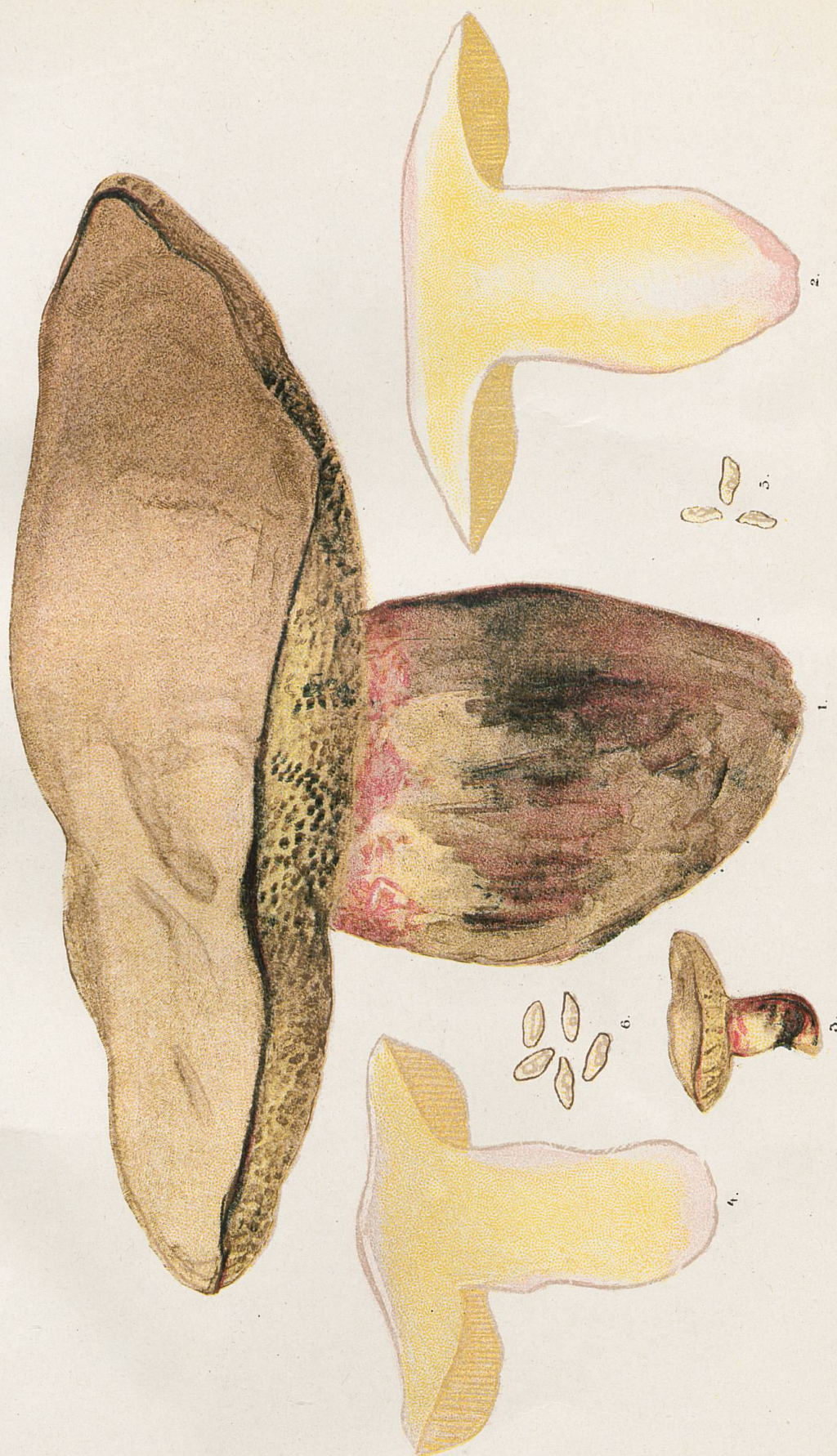
Sous-espèce validus. -1, Grandeur naturelle. -2, Demi. 3, Un septième. -4, Un tiers grandeur naturelle.