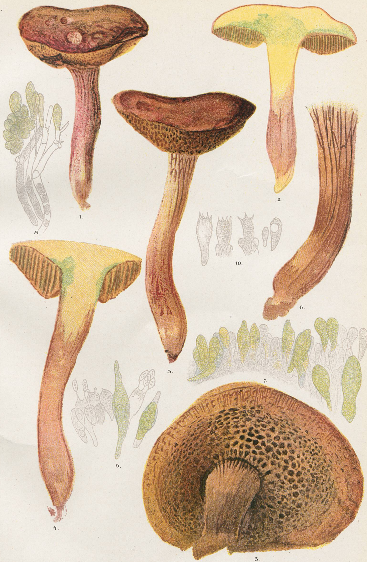
1 et 2, Sous-espèce costatipes . - 3-6, Sous-espèce reticulatipes . - 7 et 8, Marges de tubes. 9 et 10, Basides et cystides.