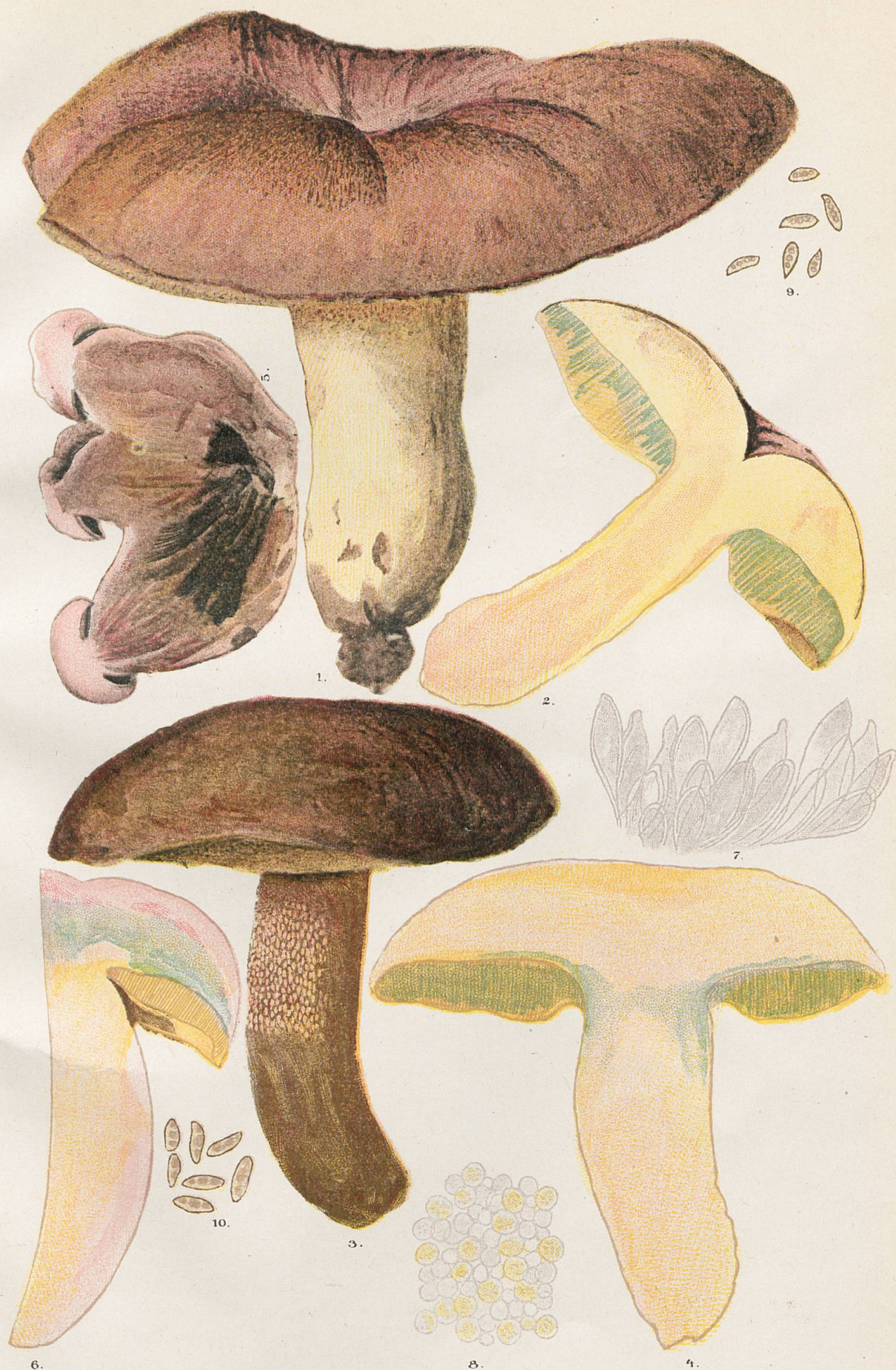
1-6, Sous-espèce irideus . - 7, Marge de tube. - 8, Hyménium vu par transparence 9, Spores du N°1. - 10, Spores du N°3.