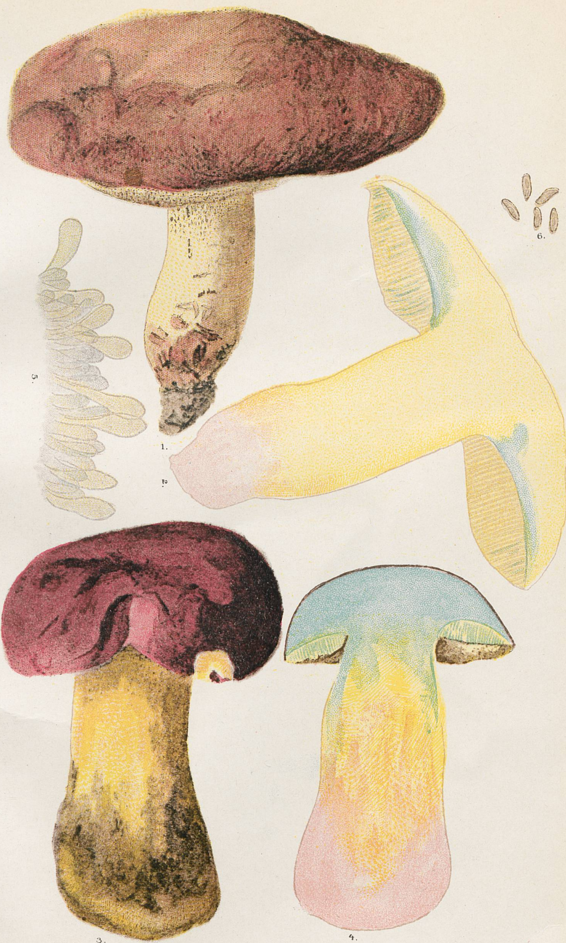
1 et 2, Sous-espèce irideus . - 3 et 4, Sous-espèce cerasinus . - 5, Marge de tube d'un irideus provenant de Langwies. - 6, Spores d' irideus .