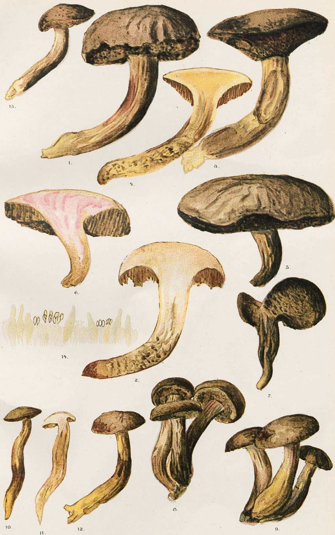
1 à 13, Sous-espèce subluridus . - 14, Marge de tube vue au microscope.