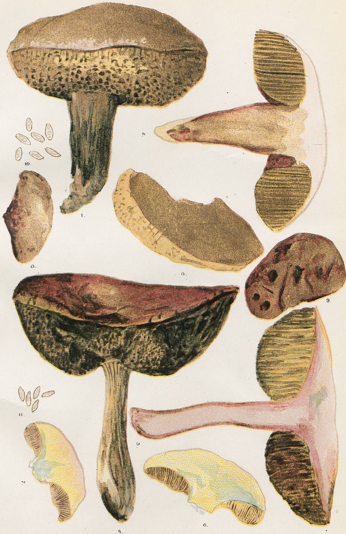
Sous-espèce reticulatipes . - 3, 8 et 9, Portions de chapeaux, pour montrer la couleur. 10, Spores du N o 1. - 11, Spores du N o 2.