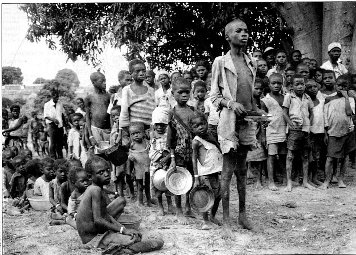
Distribución de víveres en Ganda (Angola).