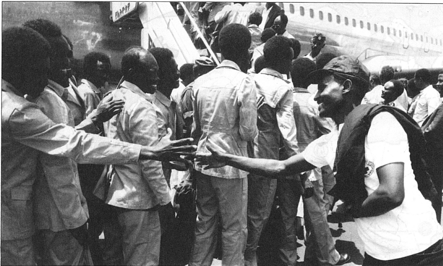
Etiopía/Somalia: repatriación de prisioneros de guerra somalíes.