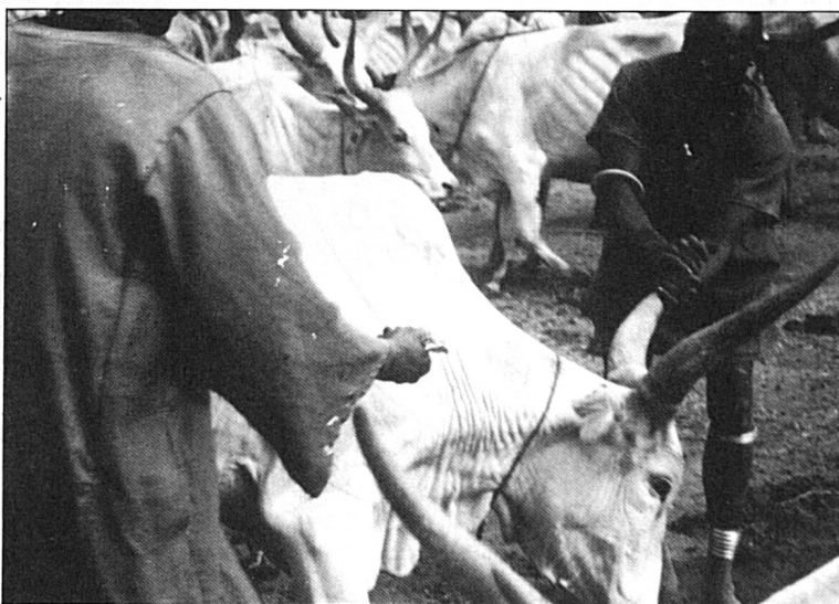
Vacunación del ganado en Sudán meridional.