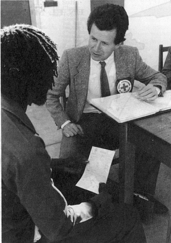
(Fotografía CICR/T. Gassmann. NAMI 87 2-10).