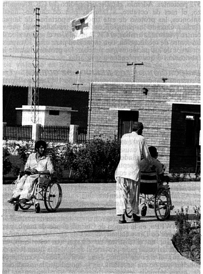
El centro para parapléjicos del CICR en Peshawar.

ASISTENCIA EN FAVOR DE LOS PARAPLÉJICOS. — Se instaló, el mes de diciembre de 1981, un centro para parapléjicos. Después de haber consultado a las autoridades pakistaníes, el CICR decidió instalar en Peshawar un centro especializado, donde se recibiría a los parapléjicos tanto afganos como pakistaníes (por supuesto, los afganos tendrían derecho al 50% de las camas disponibles), pues la idea era que la infraestructura y la técnica utilizadas hasta entonces en favor solamente de los pacientes afganos beneficiasen también a los pakistaníes víctimas de accidentes. Así, se construyó, específicamente con esta finalidad, en el transcurso de 1983, un nuevo centro, con capacidad para 100 camas; los pacientes fueron recibidos el 6 de febrero de 1984. La inauguración oficial tuvo lugar el 7 de julio, en presencia de representantes de las autoridades de la provincia nordoccidental («North West Frontier Province» -NWFP) y de dirigentes de la Media Luna Roja de Pakistán. El CICR y la sección de la NWFP de la Media Luna Roja de Pakistán firmaron, el 2 de octubre, un