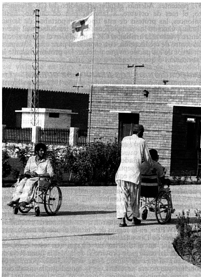
El centro para parapléjicos del CICR en Peshawar.

ASISTENCIA EN FAVOR DE LOS PARAPLÉJICOS. — Se instaló, el mes de diciembre de 1981, un centro para parapléjicos. Después de haber consultado a las autoridades pakistaníes, el CICR decidió instalar en Peshawar un centro especializado, donde se recibiría a los parapléjicos tanto afganos como pakistaníes (por supuesto, los afganos tendrían derecho al 50% de las camas disponibles), pues la idea era que la infraestructura y la técnica utilizadas hasta entonces en favor solamente de los pacientes afganos beneficiasen también a los pakistaníes víctimas de accidentes. Así, se construyó, específicamente con esta finalidad, en el transcurso de 1983, un nuevo centro, con capacidad para 100 camas; los pacientes fueron recibidos el 6 de febrero de 1984. La inauguración oficial tuvo lugar el 7 de julio, en presencia de representantes de las autoridades de la provincia nordoccidental («North West Frontier Province» -NWFP) y de dirigentes de la Media Luna Roja de Pakistán. El CICR y la sección de la NWFP de la Media Luna Roja de Pakistán firmaron, el 2 de octubre, un