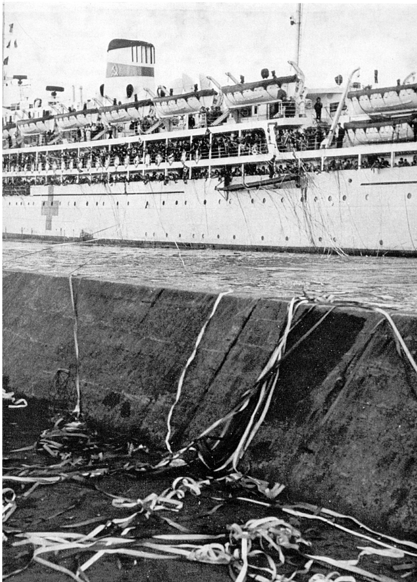
Niigata (Japón) : repatriación de coreanos.