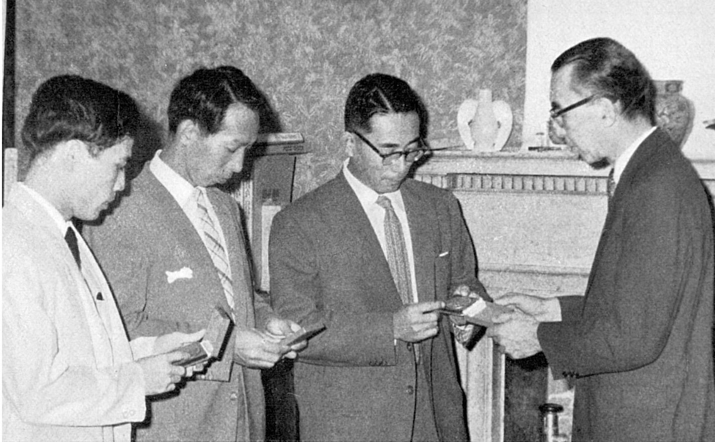
JAPON Los miembros del equipo médico japonés reciben la medalla conmemorativa del CICR. Esta medalla lleva una inscripción especial que recuerda la acción médica en el Congo.