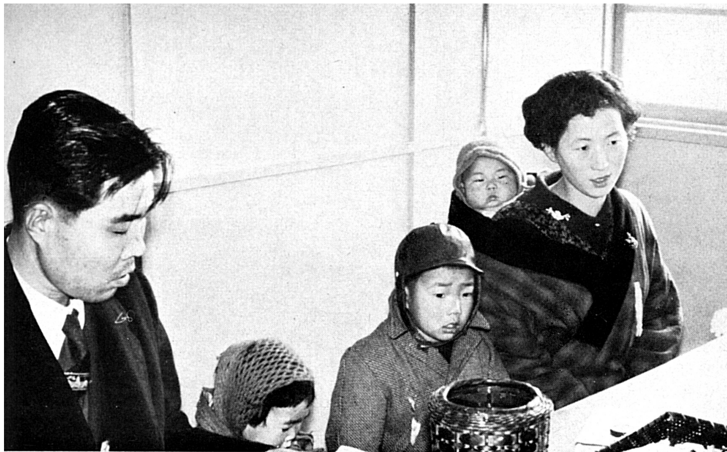
JAPON — Con el fin de ser repatriada, una familia coreana se inscribe en el centro de Niigata. (Febrero)