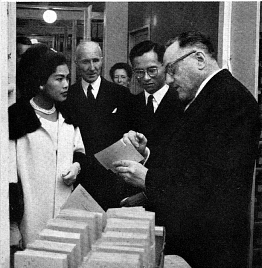
EN LA SEDE DEL CICR EN GINEBRA — Los soberanos de Tailandia visitan a la Agencia Central de Informaciones. (Noviembre)