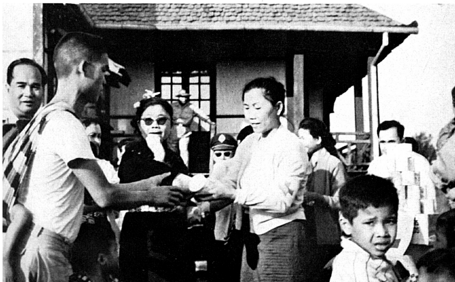
LAOS — Leche y prendas de vestir, donativos del CICR, son distribuidos por la Cruz Roja lao a los refugiados de la provincia de Paksé. (Febrero)