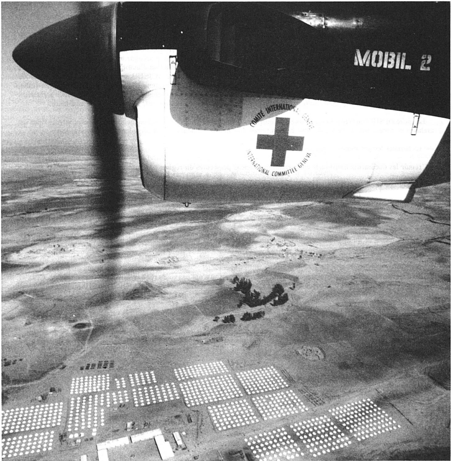
Ethiopie: un « Twin Otter » du CICR survolant un camp de personnes déplacées, à Mekele.