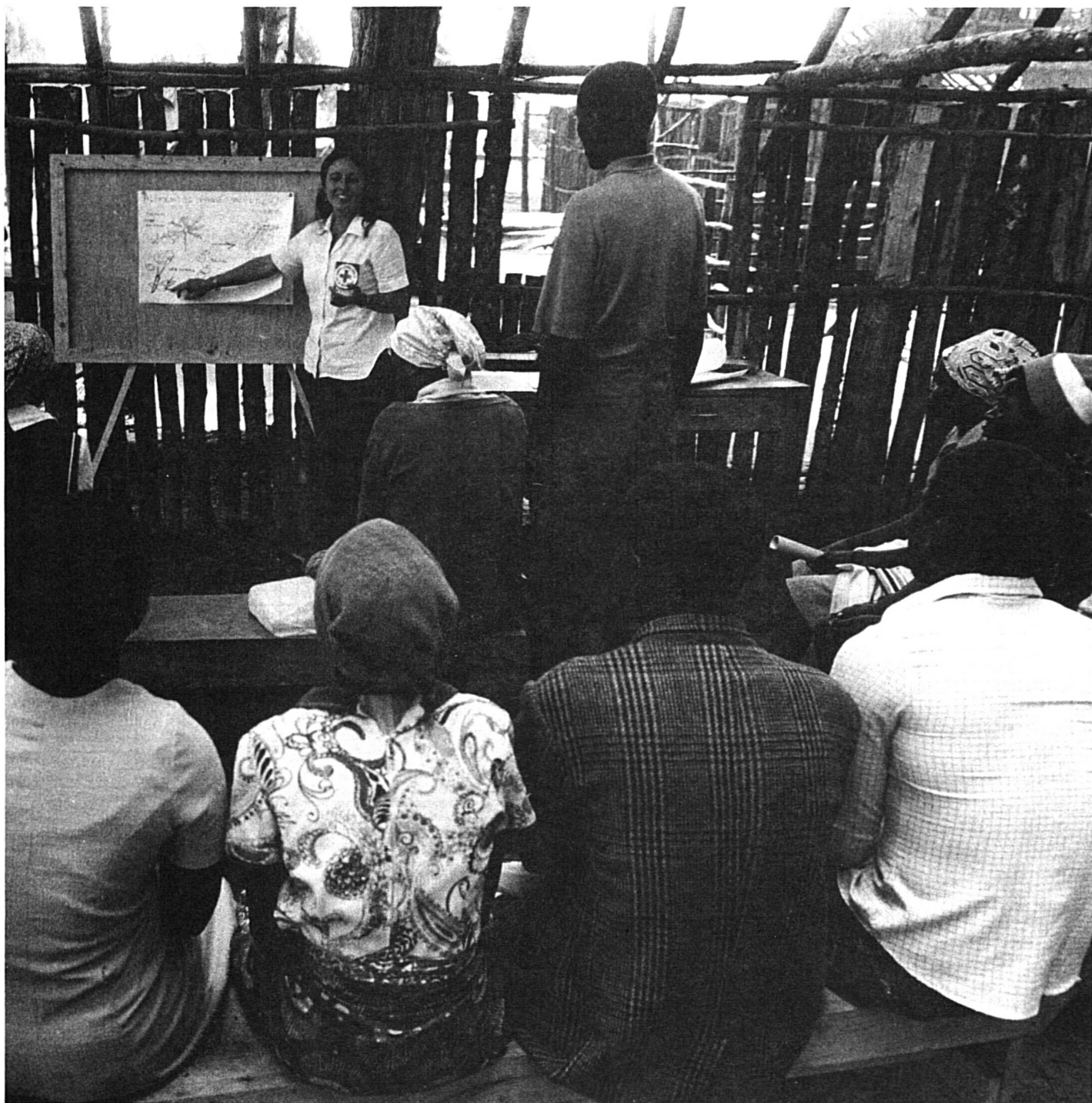
Cours d'information d'hygiène de base donné par une infirmière du CICR aux responsables des postes de santé dans un village angolais.