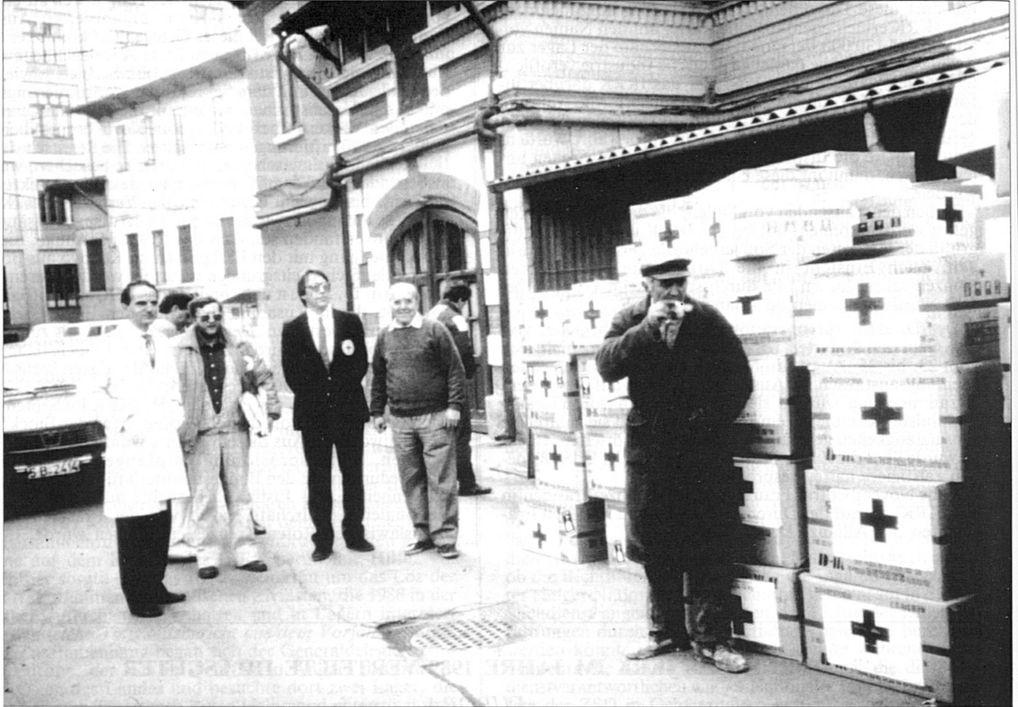
Medizinische Unterstützung für ein Bukarester Krankenhaus (Rumänien)