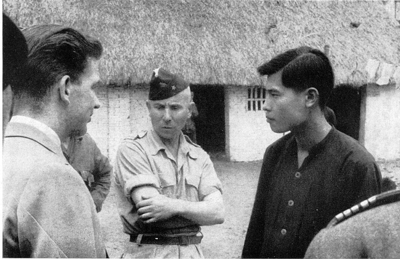
Lager Thaï-Bin (Delta des Roten Flusses). — Der Arzt-Delegierte des IKRK spricht mit einem Cai (Vertreter der Kriegsgefangenen) (12. August 1951).