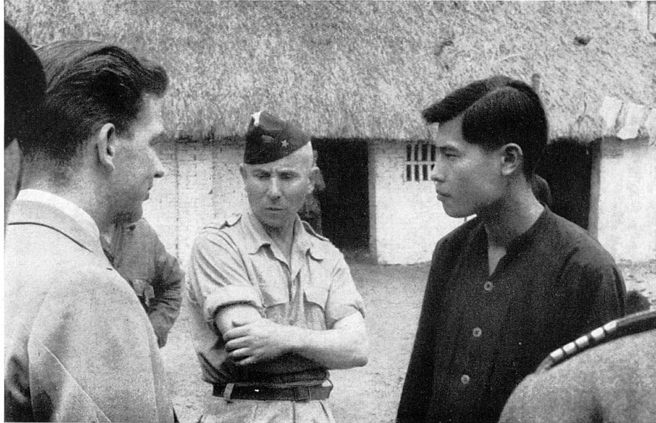
Lager Thāi-Bin (Delta des Roten Flusses). — Der Arzt-Delegierte des IKRK spricht mit einem Cai (Vertreter der Kriegsgefangenen) (12. August 1951).