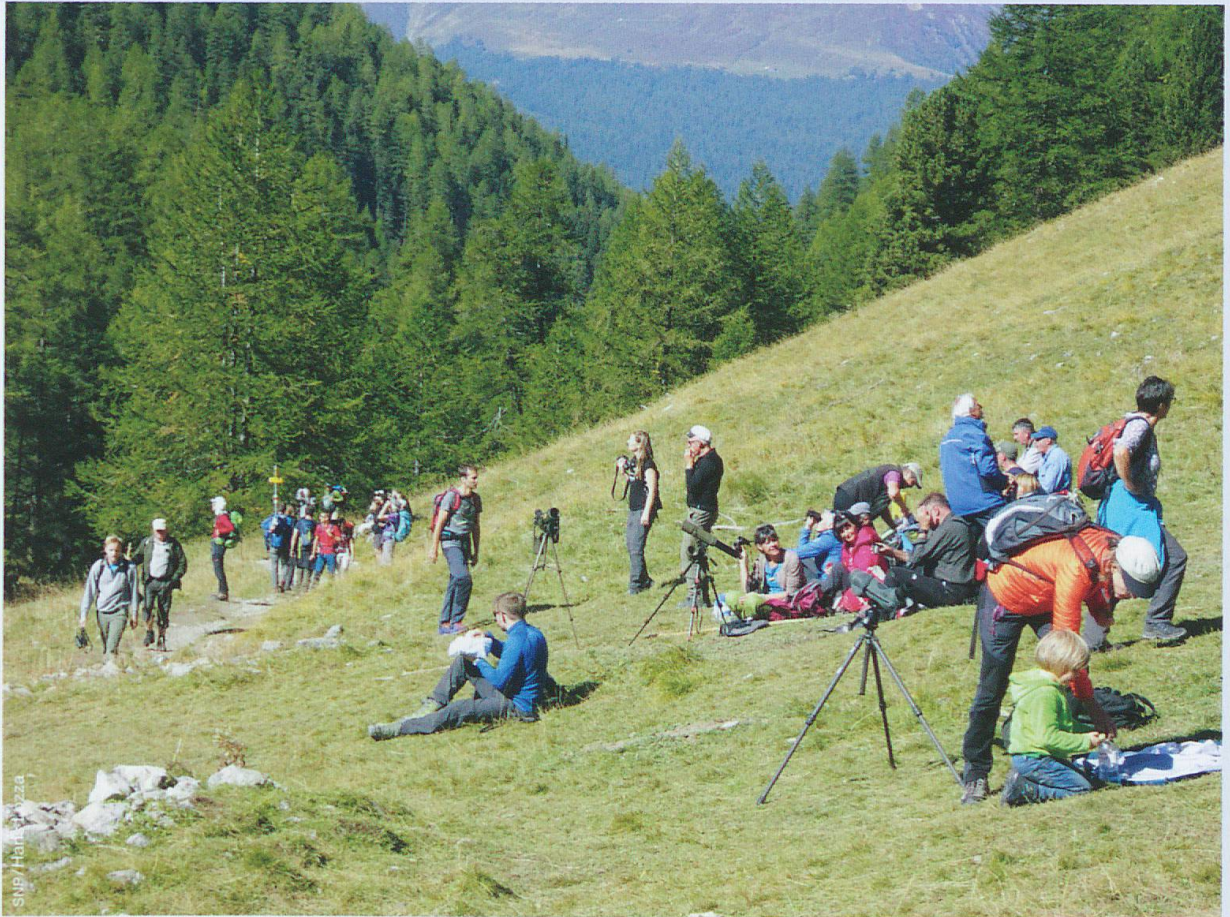
Abb. 1 Gästeaufkommen im SNP: Erstmals wurden 2020 an Rastplätzen auch Volontäre zur Besucherinformation und -lenkung eingesetzt.

aus der menschlichen Nutzung zu entlassen und vom Menschen unbeeinflusst sich selbst zu überlassen – wurde sozusagen überrannt. Die seit 2007 durchgeführten automatischen Zählungen zeigten, dass zwischen Juni und Oktober 2020 über 50 % mehr Gäste auf den Wanderwegen des SNP unterwegs waren als in vorherigen Jahren (Abb. 1). Welchen Einfluss hat dies auf den SNP?