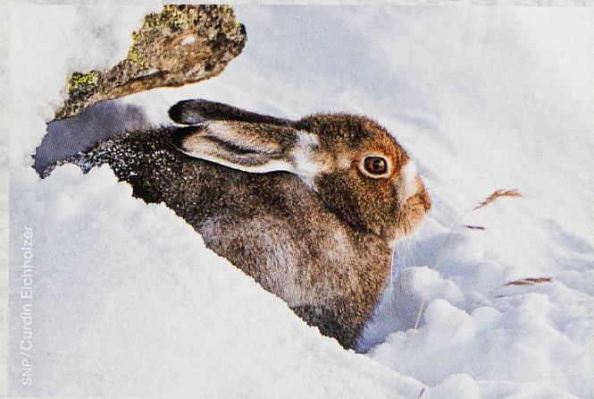
Abb. 3 Genügsamer Alpenbewohner – der Schneehase, hier im Sommerkleid

Das andere Extrem bildet der Schneehase (Abb. 3): Je nach Lebensraum bevorzugt er Nadelbaummaterial oder Zwergsträucher, beides ziemlich nährstoffarme Kost. Diese spezielle Nahrungsnische kann der Schneehase dank seines besonders angepassten Verdauungssystems nutzen: Durch Fressen des eigenen Kots wird die Nahrung zweimal verdaut, sodass die Nährstoffe selbst bei so hohem Raufutteranteil weitgehend aufgenommen werden können. 🐰