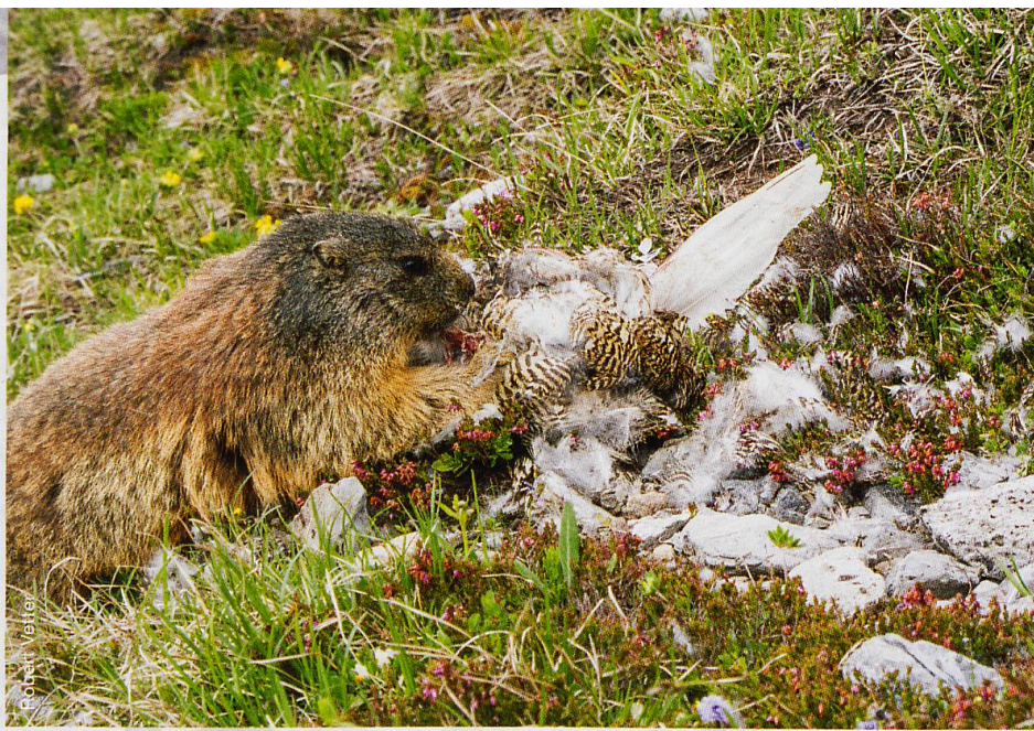
Abb. 2 Murmeltier auf Alp la Schera beim Verzehr eines Alpenschneehuhns

verbrauchen. Verhaltensanpassungen wie die stark reduzierte Aktivität im Winter sind mit wenigen Ausnahmen die Regel. Deshalb ist es auch so wichtig, dass Wildtiere besonders in dieser Jahreszeit vor menschlicher Störung, zum Beispiel durch Wintersport in den Überwinterungsgebieten, geschützt werden. Hinzu kommen neben Winterfell usw. aber auch die physiologischen Anpassungen: Huftiere ernähren sich im Winter vermehrt von schwerverdaulichem Nadelbaummaterial und Zwergsträuchern im Gegensatz zu Kräutern und Süßgräsern im Sommer. Sie haben sich im Laufe ihrer Evolution so gut an die spärliche Winterkost in ihrem Lebensraum angepasst, dass sie zu dieser Jahreszeit selbst in Gefangenschaft mit unlimitiertem Nahrungsangebot viel weniger fressen als im Sommer und gleichzeitig einen erhöhten Anteil Raufutter brauchen, um gesund zu bleiben. Eine künstliche Winterfütterung mit besonders nährstoffreichem Futter ist daher verfehlte Tierliebe.