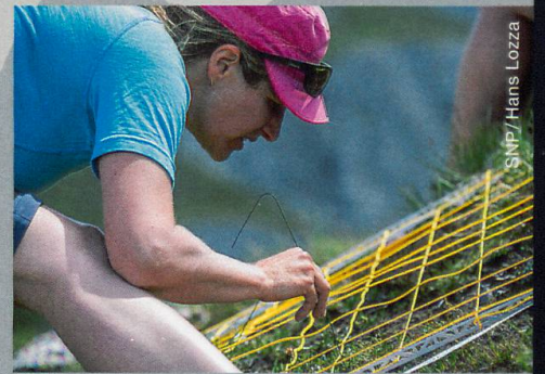
SNP / Hans Lozza