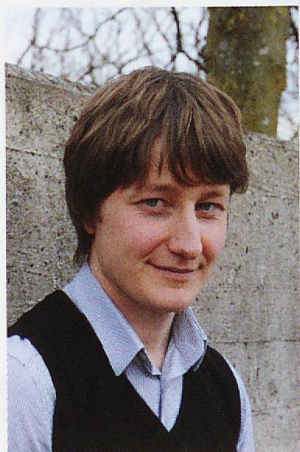
Simon Engeli Autor/Autor