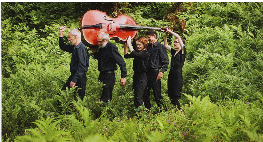
Ils Fränzlis da Tschlin