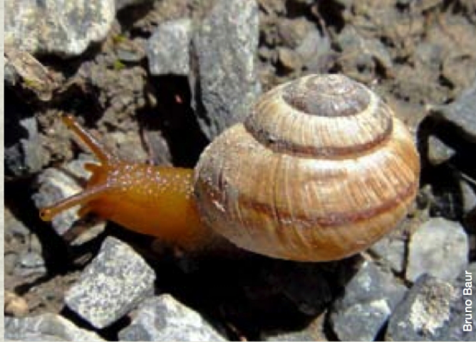
Die Gefleckte Schnirkelschnecke reagiert auf Klimaerwärmung

Bütikofer's Dissertation bildete die Grundlage für eine neue Studie. Mithilfe der historischen Karte, in welcher die damals höchstgelegenen Populationen eingezeichnet waren, sowie anhand von Geländebeschreibungen und Höhenangaben wurden in den Jahren 2011/12 die gleichen Berghänge wieder aufgesucht. Nach 95 Jahren wurde die Gefleckte Schnirkelschnecke an den gleichen Stellen wieder gefunden. Um mögliche Arealverschiebungen festzustellen, suchten die Forscher an allen Berghängen das höher gelegene Gelände systematisch ab. Das Ergebnis war eindeutig: Die Schnecken haben ihre höchstgelegenen Populationen um durchschnittlich 146 Höhenmeter Richtung Gipfel verschoben. Dabei war die Höhengausbreitung an süd-exponierten Hängen ausgeprägter als an nord- bis nordostexponierten Hängen. Allerdings kann dieses Ausweichen in grössere Höhen nicht unbegrenzt weitergehen. An zwei der neun untersuchten Berghänge haben die Schnecken senkrechte Felswände erreicht, die ein weiteres Vordringen in noch grössere Höhen verhindern.