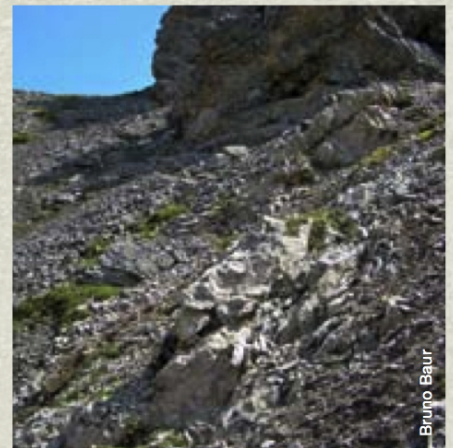
In der Val Mütschans wird die weitere Ausbreitung in noch grössere Höhen durch Felswände verhindert.