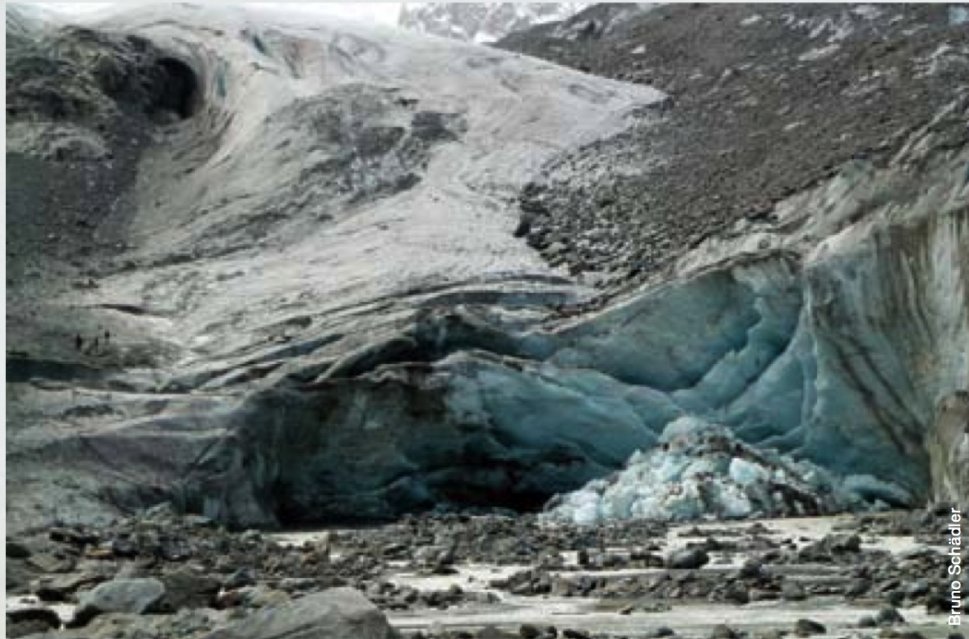
Abb. 1 An der Zunge des Morteratschgletschers ist das Abschmelzen besonders gut sichtbar.

Viel wichtiger für den Wasserkreislauf ist in den Gebirgsregionen die Verschiebung der Nullgradgrenze und damit der Schneefallgrenze und der unteren Grenze der Schneedecke um rund 500 bis 600 m nach oben. Das bedeutet späteres Einschneien, früheres Ausapern sowie eine deutlich weniger mächtige Schneedecke in tieferen und mittleren Lagen. Zusätzlich wird im Winter auch mehr Regen (und nicht Schnee) bis in mittlere Lagen hinauf fallen und so direkt zum Abfluss kommen. Nina Köplin von der Universität Bern konnte berechnen, dass im Einzugsgebiet der Ova dal Fuorn heute im Durchschnitt jeden Winter etwa 26 Mio. m 3 Wasser in Form von Schnee liegen; bis ins Jahr 2100 könnten das dann jedoch nur noch 16 Mio. m 3 sein. Das heisst, dass heute 62 % des in der Ova