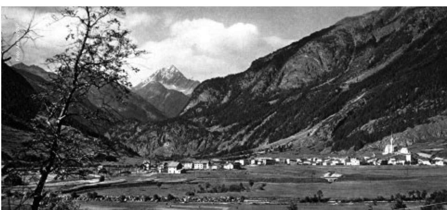
Zernez zur Zeit der Parkgründung