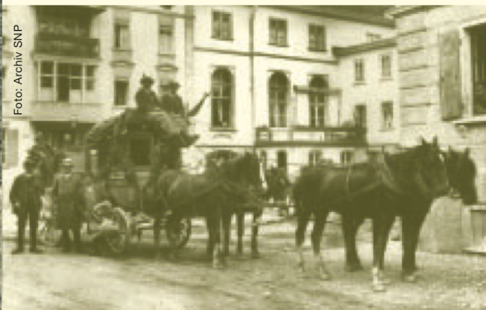
Postkutsche vor dem Hotel Baer&Post in Zernez, undat. Aufnahme. Bis zur Eröffnung der RhB-Strecke ins Unterengadin 1913 war die Kutsche das übliche Verkehrsmittel.