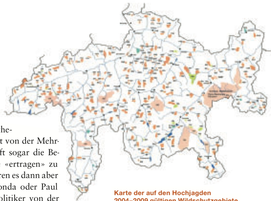
Karte der auf den Hochjagden 2004–2009 gültigen Wildschutzgebiete

Im Winter ist es ebenfalls wichtig, grosse Konzentrationen zu vermeiden, wenn mit den Reserven haushälterisch umgegangen werden soll. Unnötige Störungen, aber auch Wildkonzentrationen an attraktiven Futterplätzen wie Futterstellen, sowie das beabsichtigte oder unbeabsichtigte Bereitstellen von Futterabfällen oder Futterreserven aus der Landwirtschaft (Silage) bringen das System der Wildruhezonen durcheinander und schaden schlussendlich dem Rothirsch, dem grössten frei lebenden Säugetier Graubündens. ☾