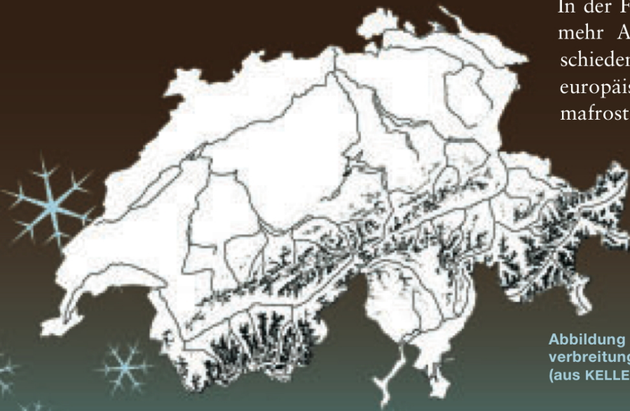
Abbildung 1: Permafrost- verbreitung in der Schweiz (aus KELLER et. al, 1998)

In der Folge schenkte die Forschung dem Permafrost mehr Aufmerksamkeit. 1996 bis 2000 waren verschiedene Schweizer Forschungsgruppen am ersten europäischen Permafrostforschungsprojekt PACE (Permafrost and Climate Change in Europe) beteiligt. Eine