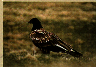
Val da Stabelchod: Aussetzungsort der Bartgeier. Im Bild das Männchen des «Zernezer Paares». Seite 10

Ameisenwanderung Route 11: Punt la Drossa-Alp la Schera ca. 1,5 Stunden Route 15: Alp la Schera-Il Fuorn ca. 1,5 Stunden. Seite 19