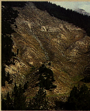
Die Waldbrandfläche Il Fuorn entstand 1951 als Folge menschlicher Unachtsamkeit. Seite 18