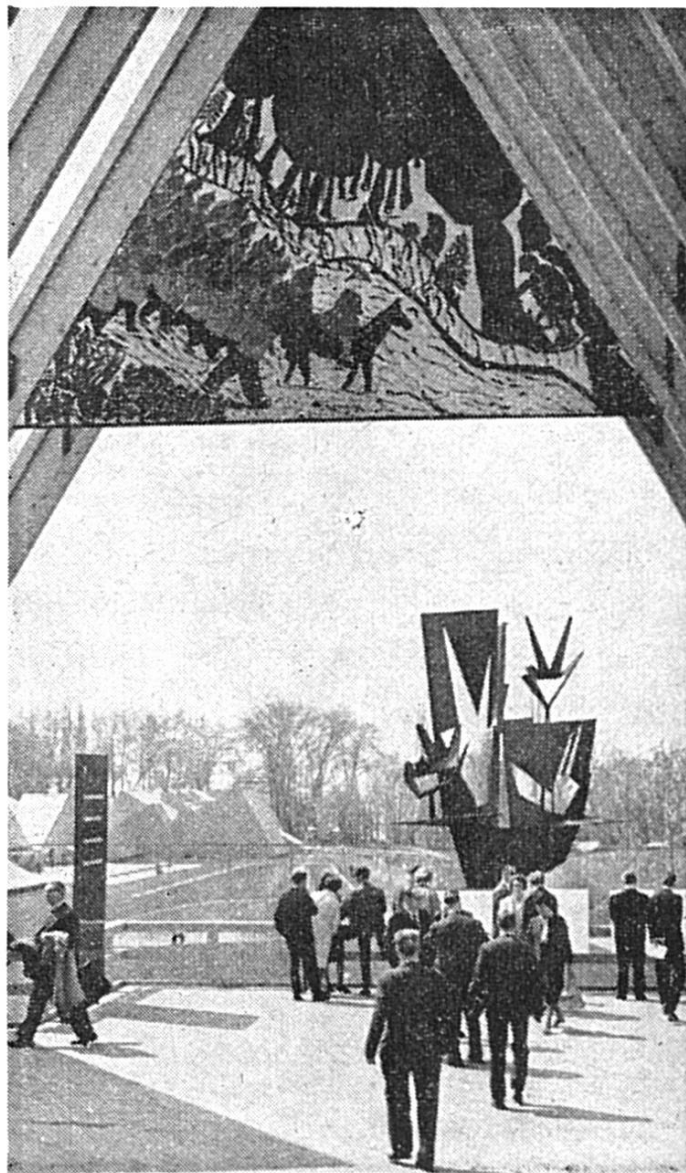
Dernière vision de l'« Expo 64 » : Le Serment des Trois Suisses! (FAL)

sentés.) Quant aux disques, leur exploitation commerciale (vente du solde, rééditions, créations éventuelles et publicité) va être confiée à une importante maison spécialisée que nous vous indiquerons en temps opportun. En attendant que soient signés les contrats, le soussigné reste à votre disposition pour vous envoyer le disque qui manque encore à votre collection ou que vous vous ferez un plaisir d'offrir à vos amis.