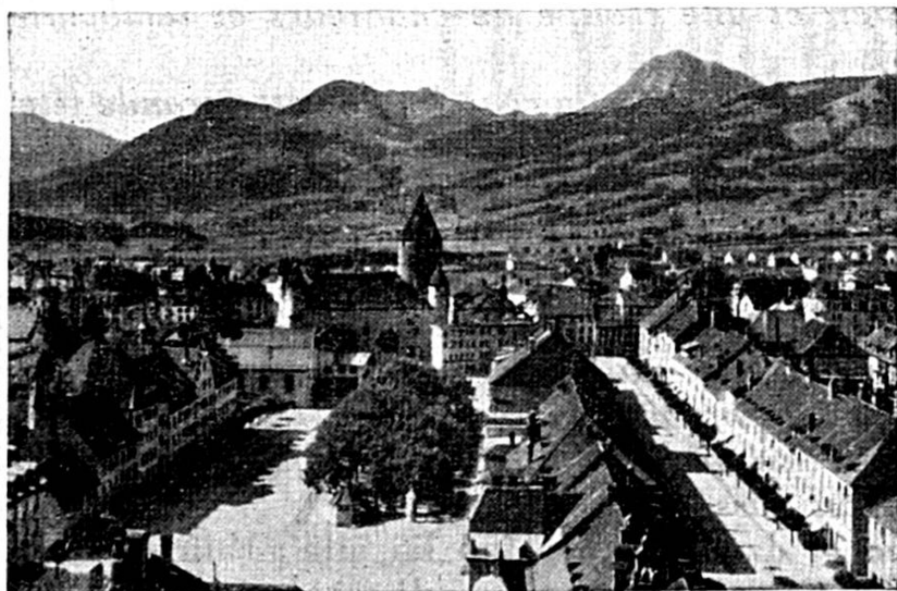
Vue de Bulle à vol d'oiseau.