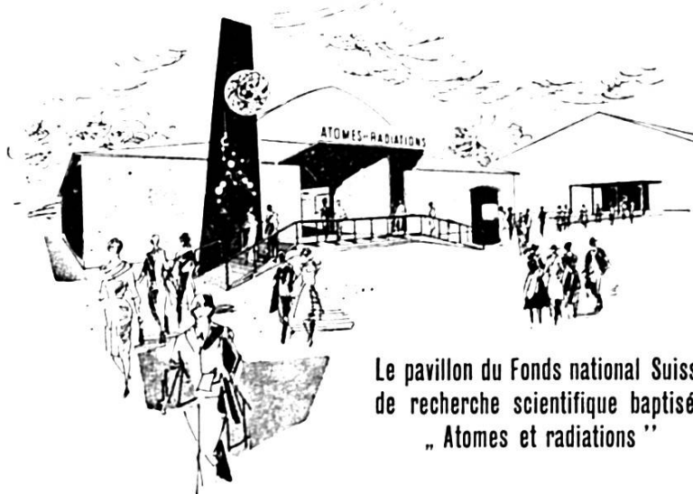
Le pavillon du Fonds national Suisse de recherche scientifique baptisé : „ Atomes et radiations ”

Enfin, les expositions de bétail, dans les nouvelles halles d'exposition que 1953 inaugurera, se succéderont, témoignant de l'effort de nos éleveurs. Une journée agricole sera célébrée le mercredi 16 septembre.