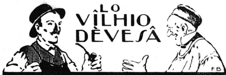
A LA CAVA DE COUMOUNA

W O sède que, dein noutron paï, lè demi-sordâ — dan cliâo de quieinze à veingte an, — dussant oncora l'ao recordâ l'hivèr dein dâi z'ecoûle que lâi diant complémentaire. Ti lâi deçando la vèprâ, hardi !