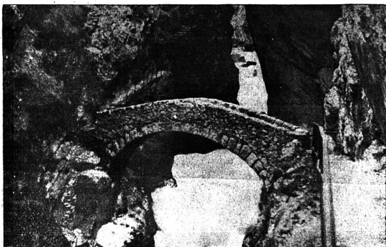
Le pont de Brot