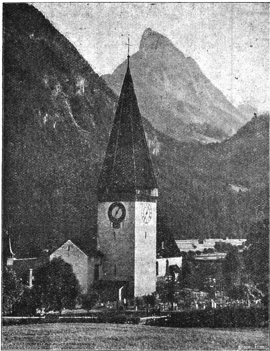
L'Église de Saanen et Le Rübli.