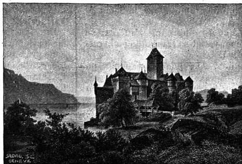
LE CHATEAU DE CHILLON